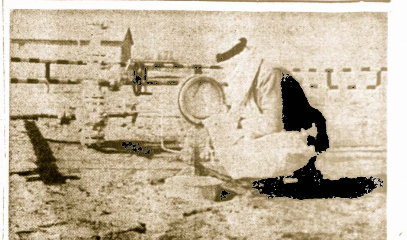
I naftos pramonę Saudi Arabijoje Amerikos bendrovės yra investavusios stambius kapitalus. Čia matome vieną naftos pompavimo stotį. JAV deda pastangas apsaugoti naftos laukus nuo arabų partizanų sabotazo veiksmų.

Sekantį dieną po diplomo įteikimo jos motina Julė Zostautienė ir dukrė išskrido dviejų savaitėms atostogų į Havajus.