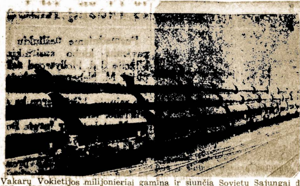
Vakary Vokietijos milijonieriai gamina ir siunčia Sovietų Sąjungai didelius kiekius naftotiekio ir dujotiekio vamzdžių.