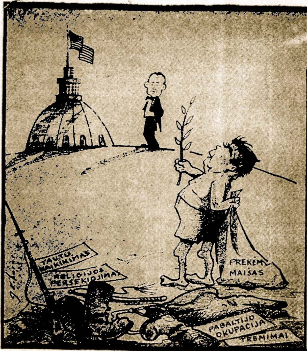
Apnuogintas tautų pavergėjo Brežnevo vizitas Washingtone

Turimus lėktuvus sumoderino ir pritaikė paskutinių laikų reikalavimams, Izraelyje vykdoma milžini-