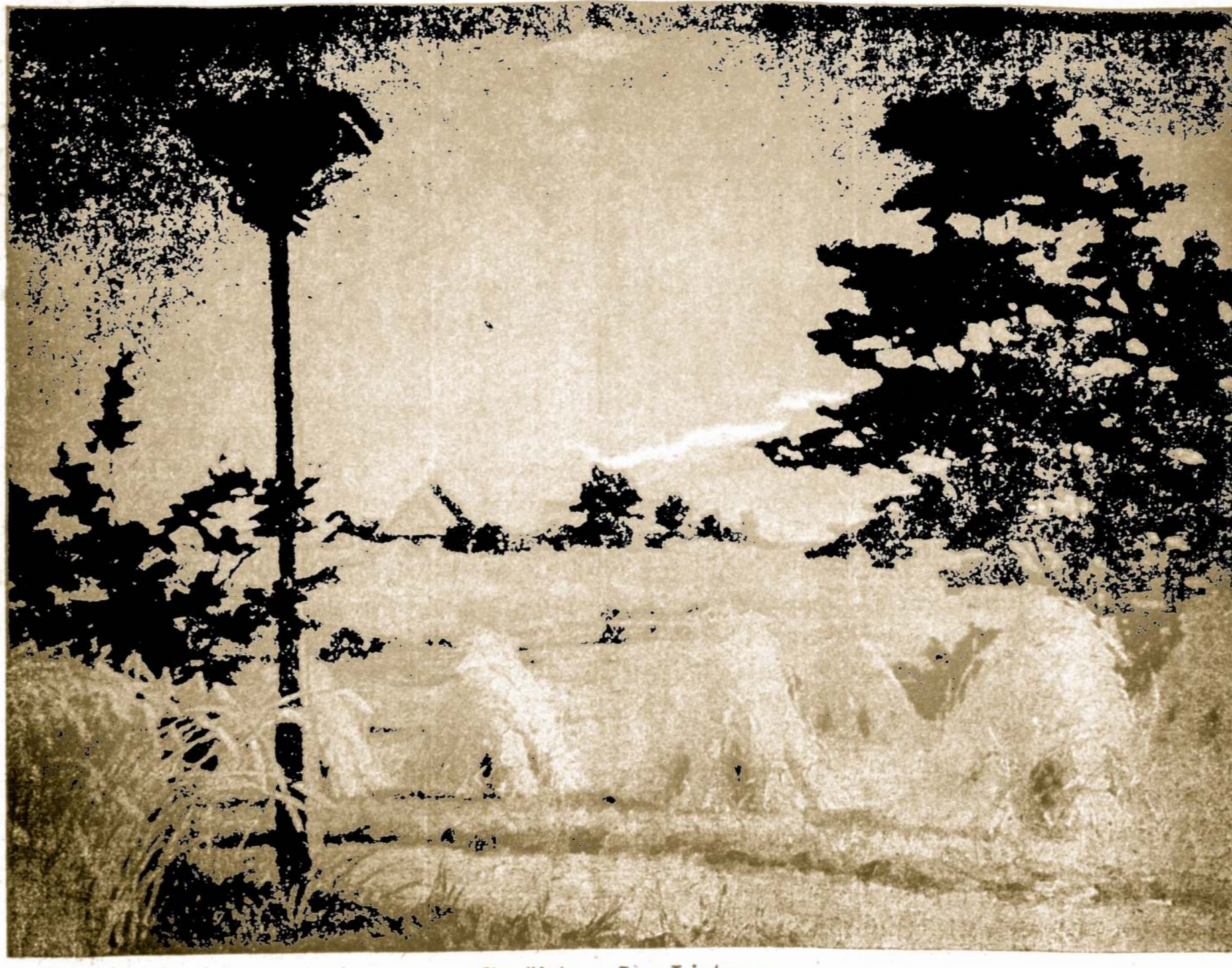
Graži ta mūsų Lietuva.

Peronas pargrįžo į Argentiną nuolatiniame apsigyvenimui ir žada bendradarbiauti su dabartiniu prezidentu Campora. Taip pat žada savo žmonos, mirusios nuo vėžio, Evos lavoną, paguldytą šdabriniam mekarste, pargabenti į Argentiną ir padėti į specialiai įrengtą mauzolėjų.