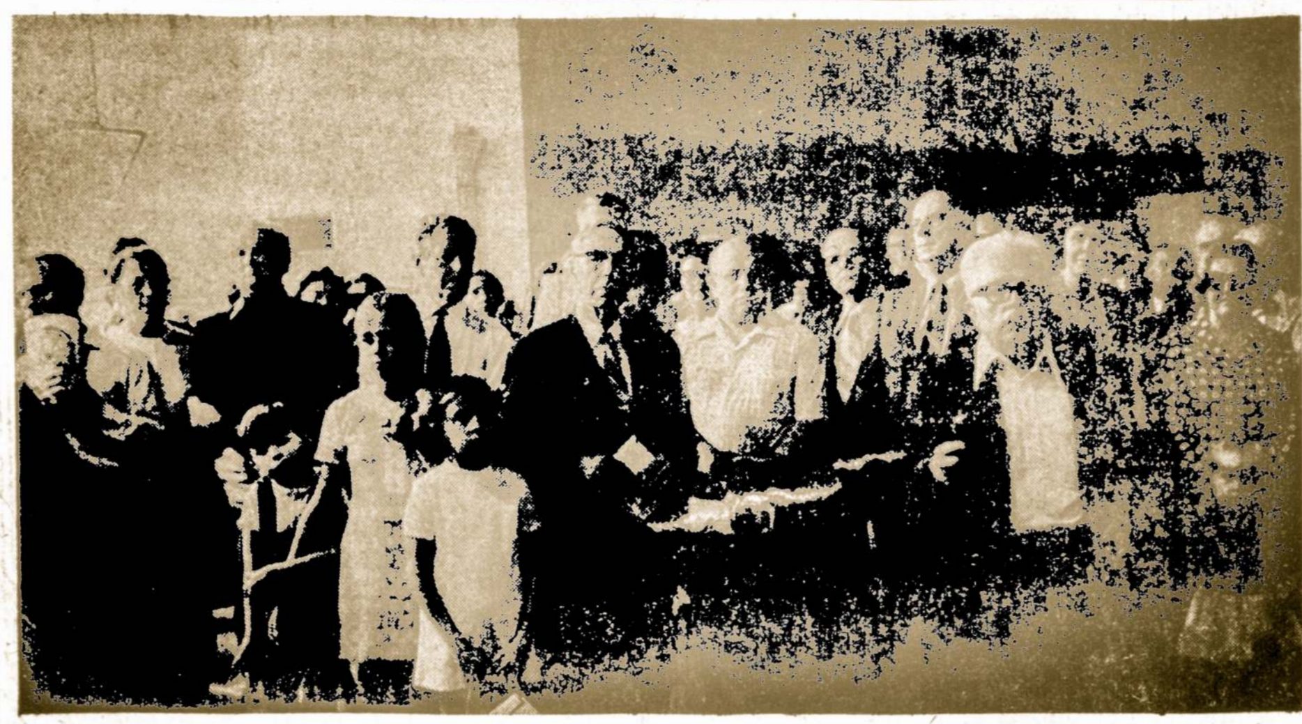
Genocido parodos atidaryme Marquette Parko lietuvių parap. salėj.

Pakrantių sargyba išgelbėjo 320 keleivių ir įgulos narių ištraukė 20 lavonų.