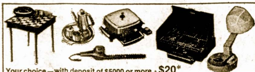
Your choice — with deposit of $500 or more — $20*