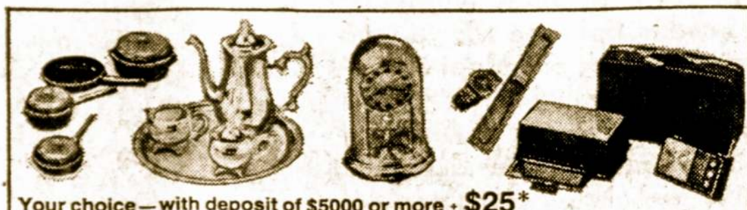
Your choice — with deposit of $500 or more — $25*