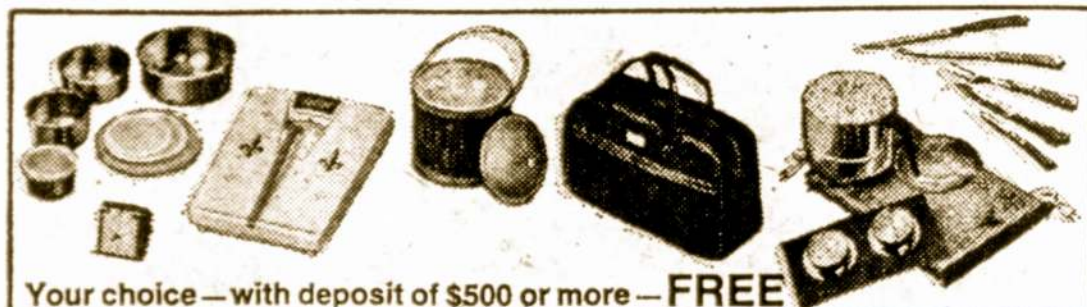
Your choice — with deposit of $500 or more — FREE