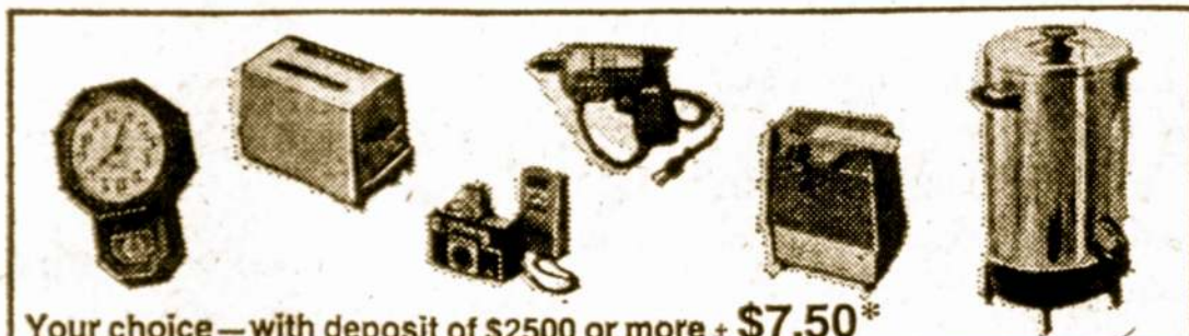
Your choice — with deposit of $250 or more — $7.50*