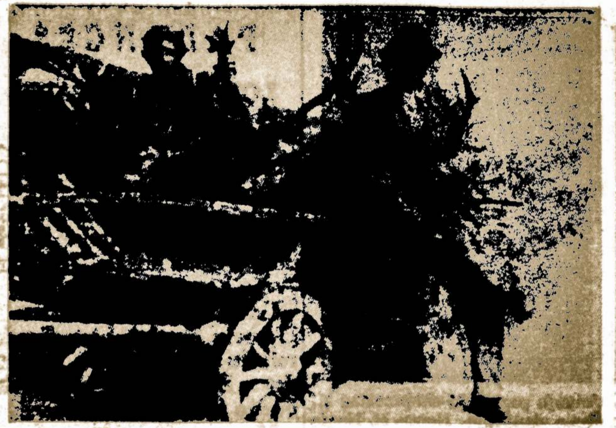
Laimingi sveikatos medžiotojai. Bet tokie laimikiai labai reti. Dažniau tenka pasitenkinti žuikiu ar paklydusia kate...