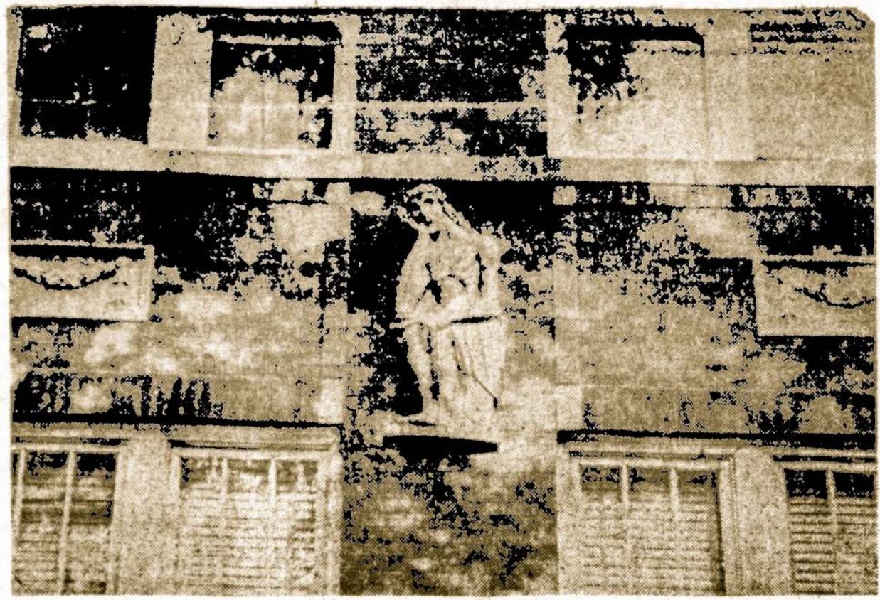
Alvudo įrušta Lietuvių sodyba Chicagoje pasipuošė skulptoriaus A. Marčiulionio sukurta lietuviškojo Smūtkelio skulptūra.