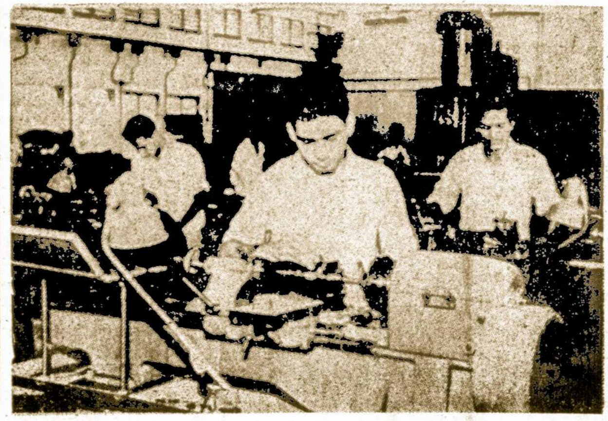
Vak. Vokietija padeda techniškai atsilikusiems kraštams. Mdrase, Indijoje jie įsteigė inžinierių paruošimo institutą

Ir tokioje kariaujančioje taikoje yra didelis trūkumas maisto. Prezidentas Nguyen Van Thie įsakė kareiviams kiekvieną grūdą vertinti tiek pat, kaip šovinį.