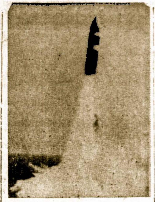
Amerikos karinė raketa "Poseidonas". Pavojaus atveju gali būti paleista i priešą per 15 sekundžių.

Nesikelk su gandrais, su varnoms nukrisi.