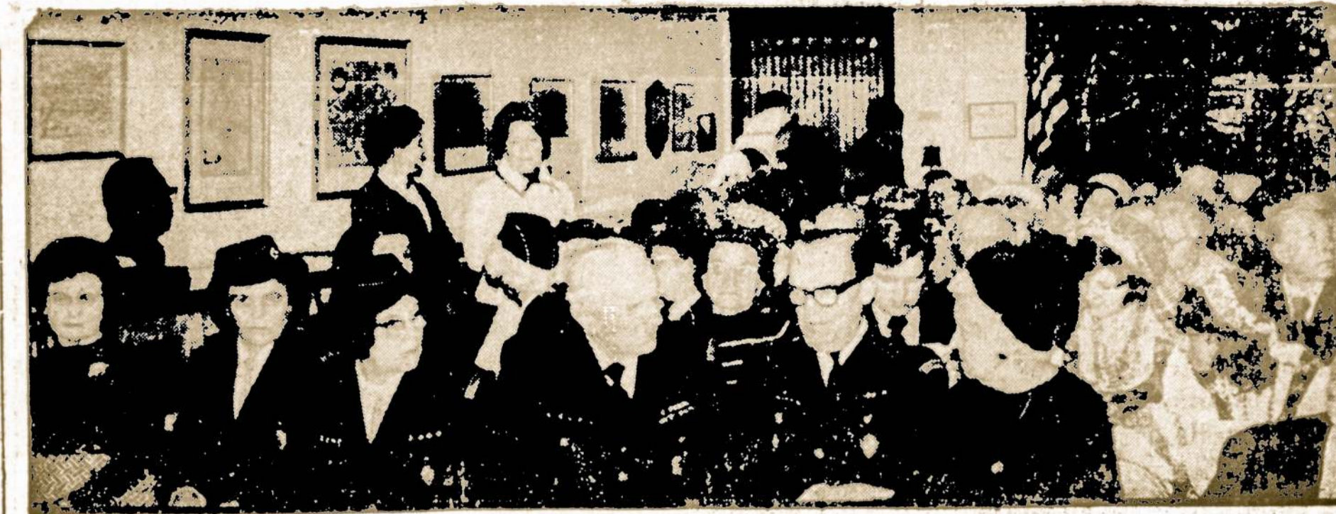
Lietuvos kariuomenės atkūrimo minėjimas buvo suruoštas St. Balzako liet. kultūros muziejuje. Čia matome dalį jo dalyvių.