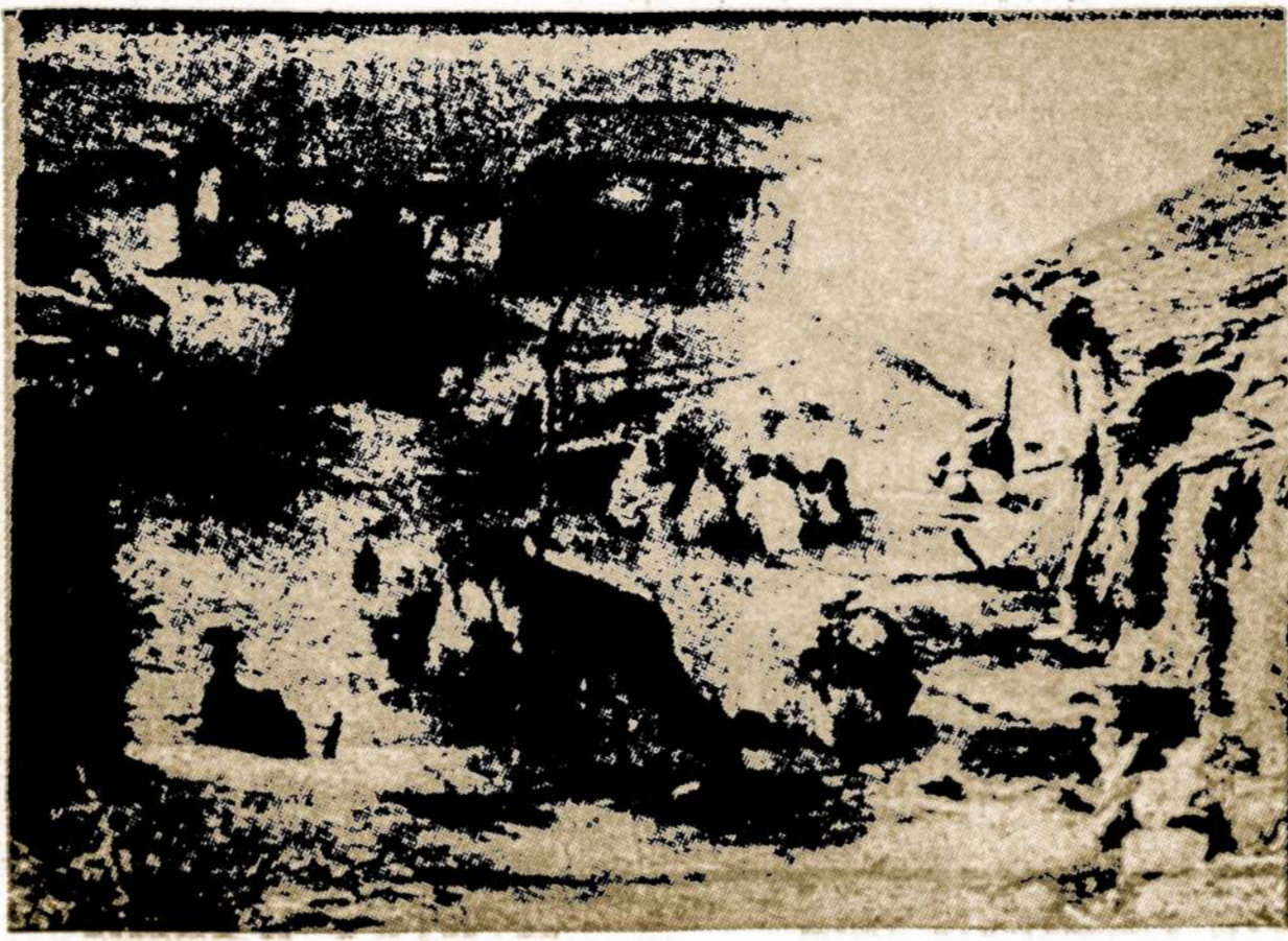
Indija gyventojų skaičiaus atžvilgiu antra iš eilės gausiausia valstybė pasaulyje (po Kinijos). Tačiau šis kraštas yra vienas iš skurdžiausių pasaulyje. Atvaizde — Indijos kaimas.

Vienok mūsų organizmas daug geriau veiks, jei išgersime porą kvortų skyščių, ne vien vandens, bet kavos, arbatos, pieno, vaisių sunkos li pan.