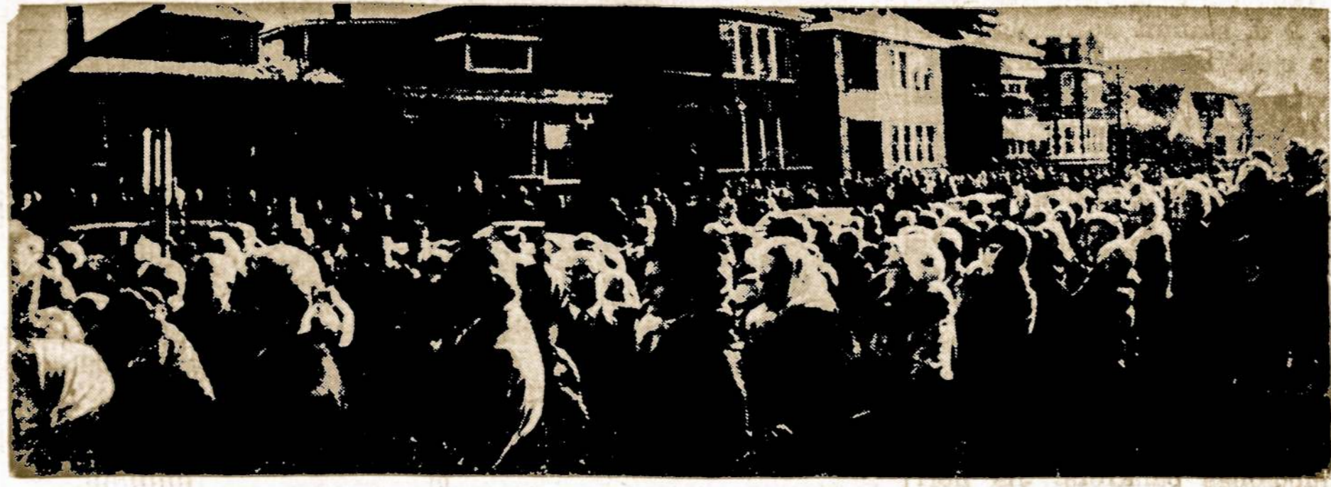
Dvitykstantinė lietuvių minia dalyvavo lietuvių tautinės vėlavos šventinimo ir iškilimo iškilimėse prie Marquette Parko lietuvių parapijos mokyklos. Kartu su lietuviška vėlavą buvo pašventinta ir iškelta nauja amerikiečių vėlavą. Lietuvių vėlavai stieba pastatė ir vėlavomis pasirūpino Marquette Parko LB apylinkės valdyba.

Per Naujuosius Metus ak- tyviai pasirodydavo jaunimas tiek stengdamasis įspėti savo ateities svarbiausią klausimą: už kurio bernelio tekės ar ku-