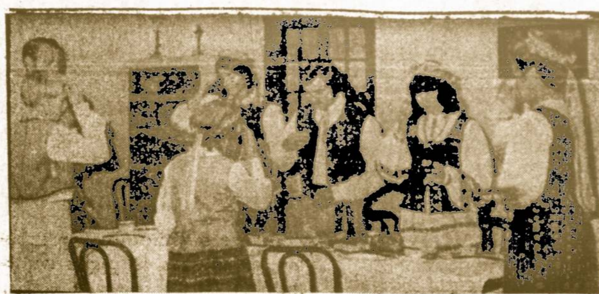
Lietuviškos kūčios Chicago Mokslo ir pramonės muziejuje, gruodžio 8 d. lietuvių programoje.

— Pasisekimo paslaptis yra išstvermingumas nusistatyme. Disraeli.