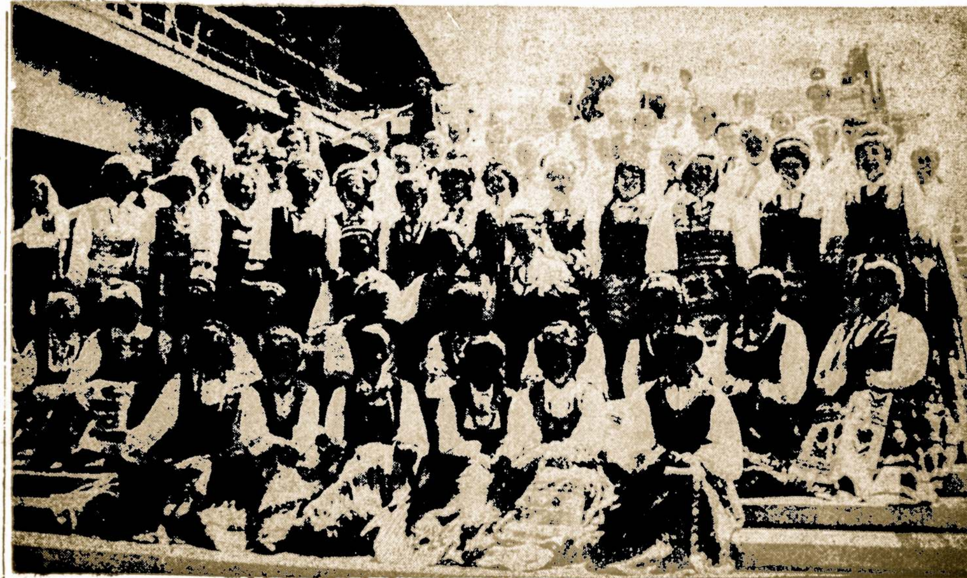
Australijos lietuvių Dainos choras ant Sydney Operos rūmų

Kinija ligi šiol nesikišo dėl tų salų, bet jį tas salas pretenduoja. Pietų Vietnamo, Filipinų ir Formozos kariuomenės jau randasi penkiolikoje to archipelago salėlių, kur tikisi didelių išteklių naftos.