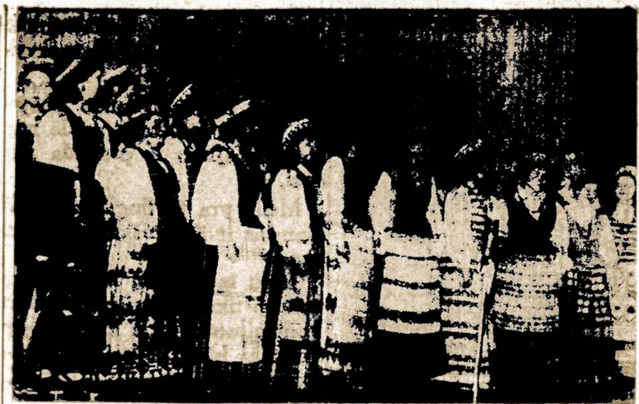
Lietuvos nepriklausomybės atkūrimo Vasario 16-sios šventės minėjime Chicagoje dainavo Lietuvių operos moterų choras.

Daug kas yra girdėjęs apie Birštono kurortą su pagarsėjusiais gydymais šaltiniais.