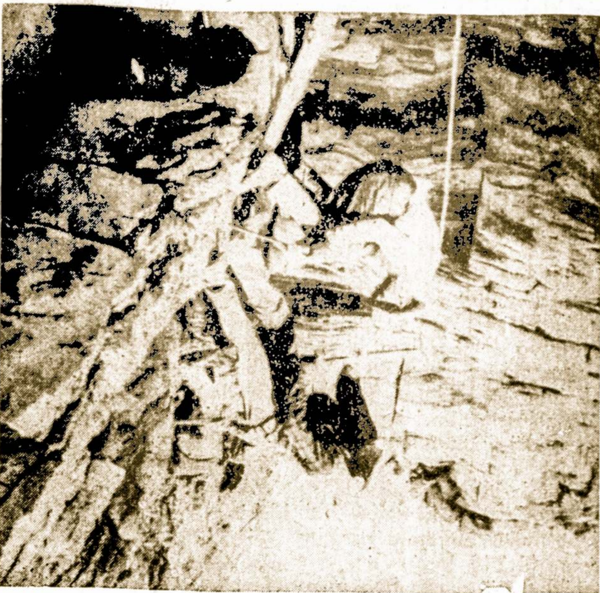
JAV-bių geologai atlieka tyrimo darbus, ieškodami naftos Rocky kalnuose. Manoma, kad šioje srityje slepiasi didžiuliai naftos kiekiai

Tas sprogdinimas buvo 430 Nėvados dykumoje.