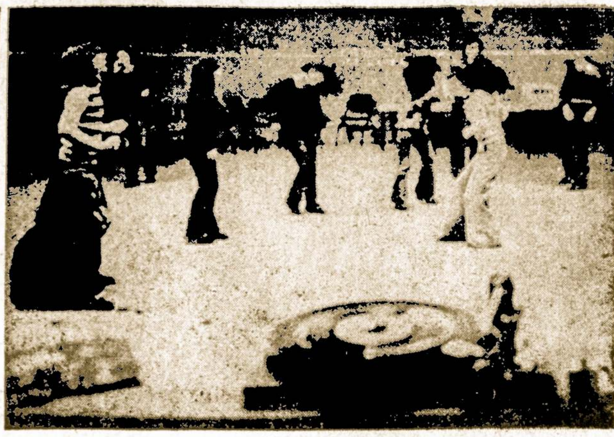
Neorganizuotas Vakarų Vokietijos jaunimas laisvalaikio metu. Laikraščiai rašo: "Nori visada linksintis, nenori mokytis ir dirbti"