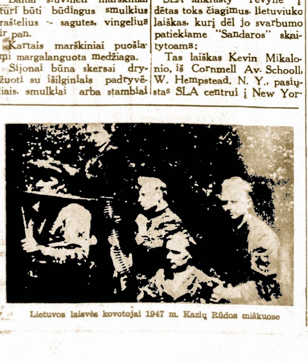
Lietuvos laisvės kovotojai 1947 m. Kazlų Rūdos miškuose