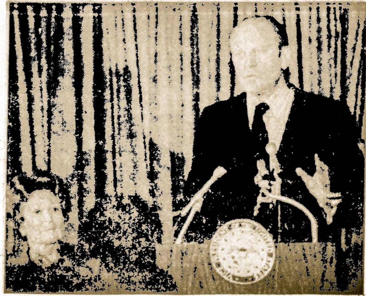
Viceprez. Gerald Ford respublikonių moterų suvažiavime. Dešinėje JAV prezidento žmona ponja Nixon.

muo tampa auka įvairių infekcijų, o ypač plaučiuose.