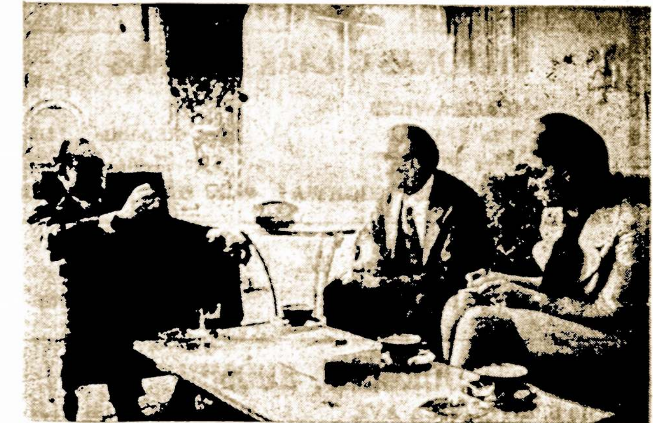
Teherane įvyko Vak. Vokietijos - Irano konferencija, kurioje buvo aptarti abiejų kraštų ekonominio bendravimo klausimai.

FLORIDA - Ft. Meyer Area. Resid. lot 84x125 ft. Channel water rights lead to the Gulf of Mexico. $6,600 TECHMAN REALTY. 749-0675