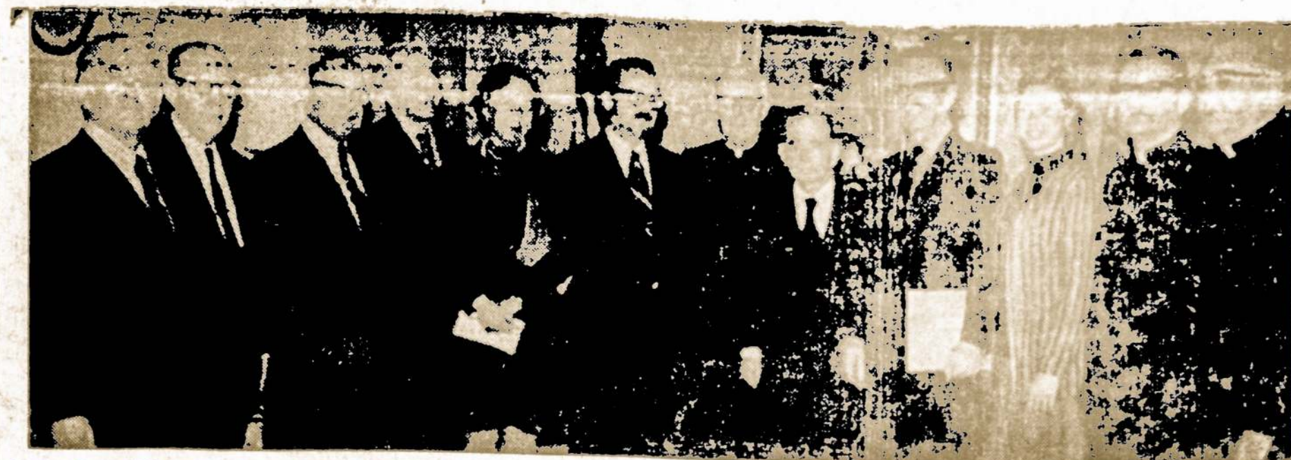
Amerikos Lietuvių Tarybos delegacija su senato daugumos pirmininku Albert ir kitais pareigūnais Washing- tone

joju, kad koks nors humoris- tas, išjuokias žmonių klaidas ir gyvenimo standartines for- mas, pelnytų dangaus karaly- stę.. (Feljetono pabaiga)