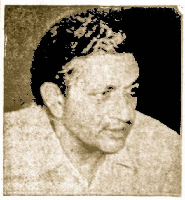
Profesorius Homi Sethi, pagaminęs Indijai atominę bombą

Prez. Tito priėmė 500.000 esančių Vokietijoje darbininkus jugoslavus, paaiškindamas tų abiejų kraštų diplomatinių santykių naudą.