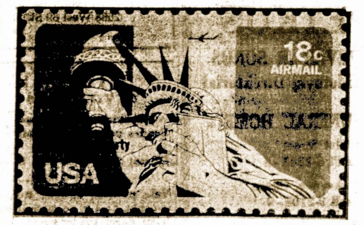
Tokį pašto ženklą išleidžia JAV paštas.