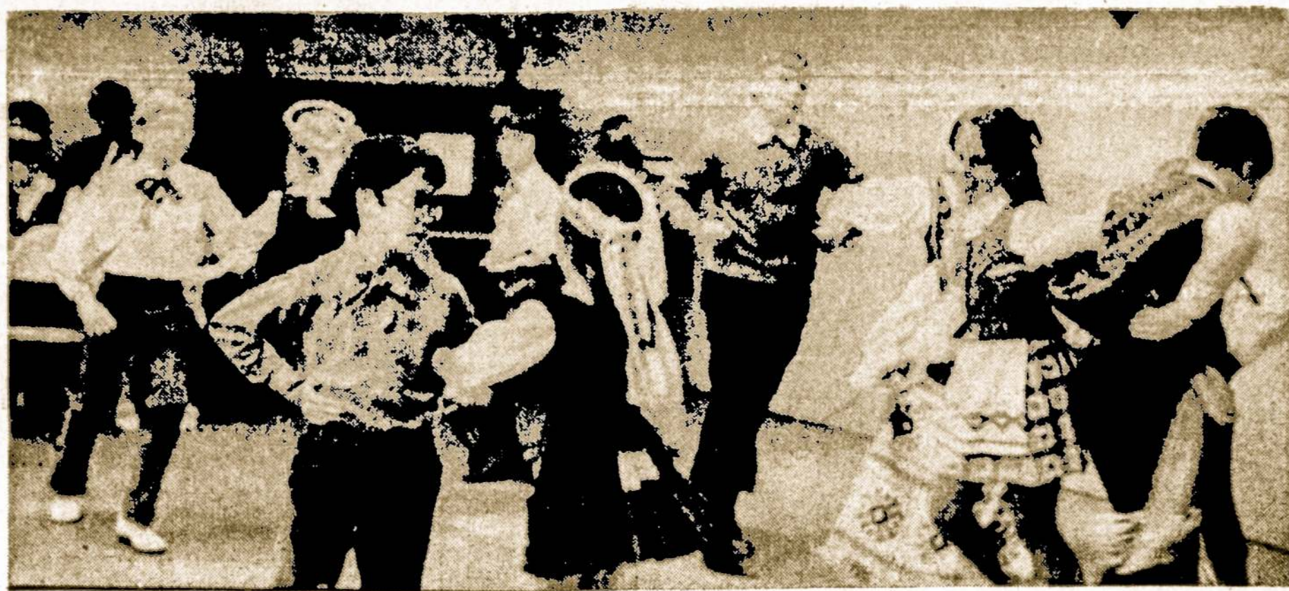
Hartfordo lituanistinės mokyklos jaunųjų mokinių šokių grupė šoka tautinius šokius Motinos dienos minėjimo ir mokslo metų užbaigime V. 12. parapijos salėje.

Ji tinka visose Visatos galaktikos sistemoje; ir Paukščių take ir už jo.