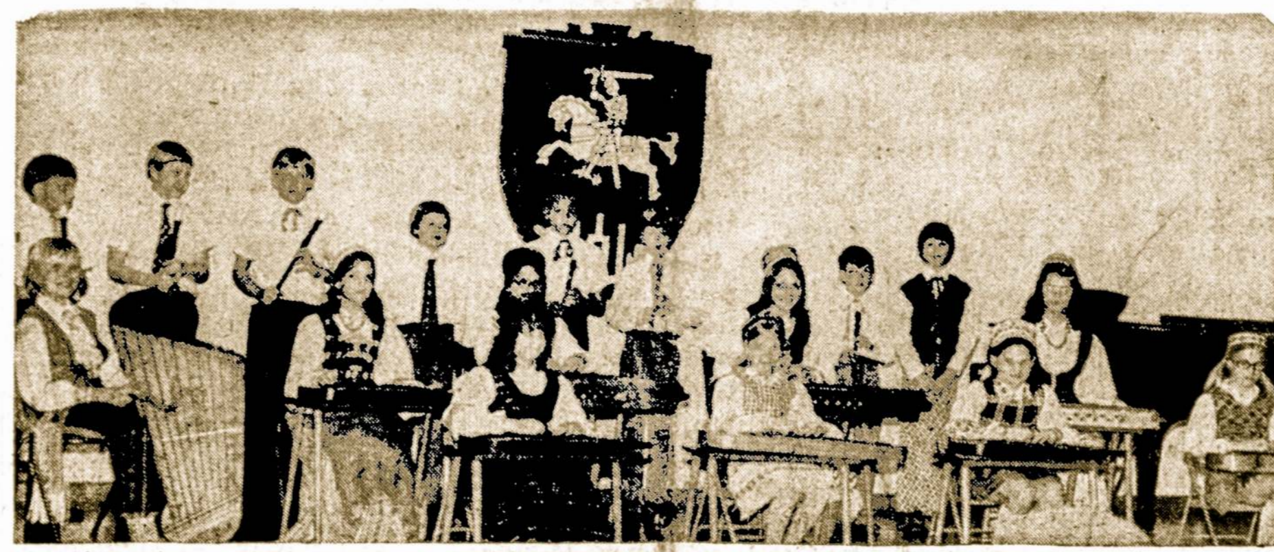
Clevelando lituanistinės mokyklos kanklininkai.

Vėliau Erlichman laukia kito teismo proceso, kuriame šalia jo kaltinamųjų suole atsises buvęs generalinis prokuroras John Mitchell, buvęs Baltojo Namų štabo šefas H. R. Haldeman, buvęs generolas pokurotas Robert Mar-dian, b. Baltojo Namų asistentas Gordon Strachan ir Nixono rinkimų komiteto pirmininkas Kenneth Parkinson.