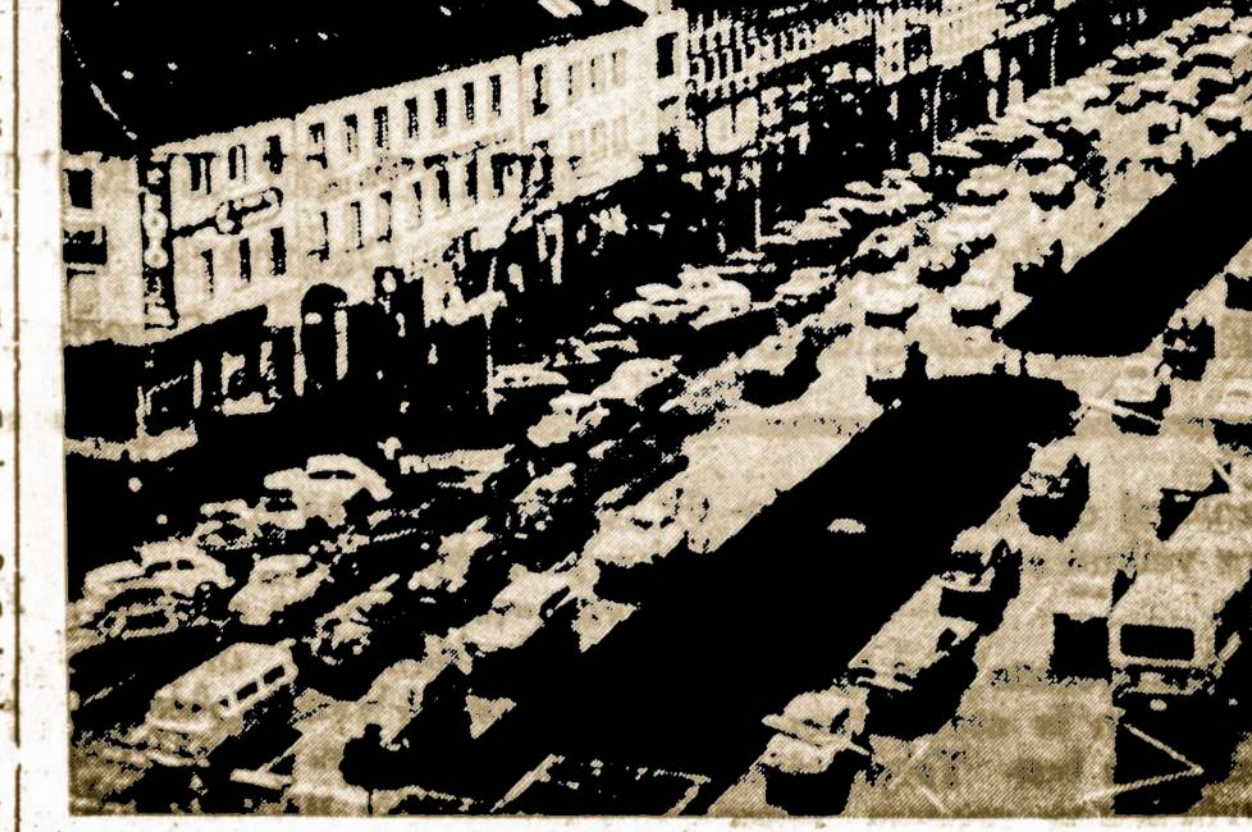
Vokiškų automobilių volkswagenų gamyba, pasibaigus energijos krizei, vėl emė augti. Nuotraukoje -- volkswagenų gamybos centras Wolfsburg, V. Vokietijoje

Dvieju stiklinių pieno per dieną pilnai užtenka suaugusiam.