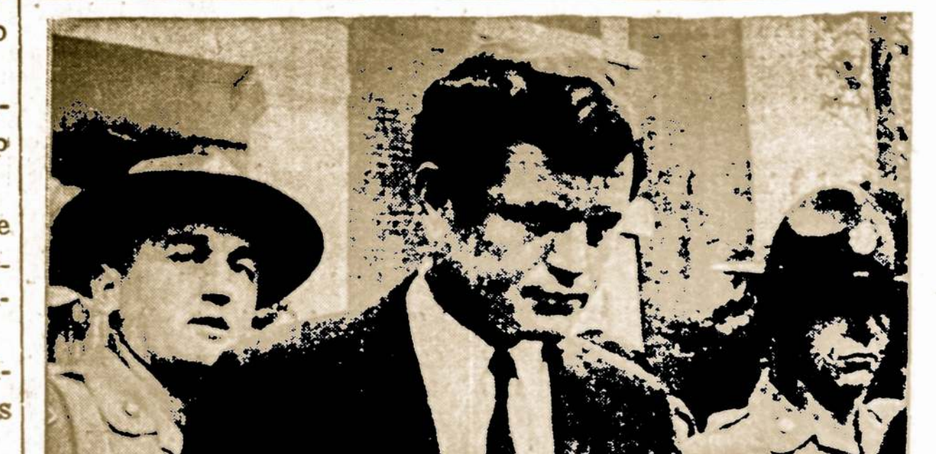
Senatorius Edward Kennedy iškilmingai pareiškė nekandidatuosis į JAV-bių prezidento postą. Čia matome jį 1969 m. Chappaquiddick byloje metu

Alšėnų (Allensten) apskrity, Rytinėj Prūšioj ežerai sudarė trečdali paviršiaus