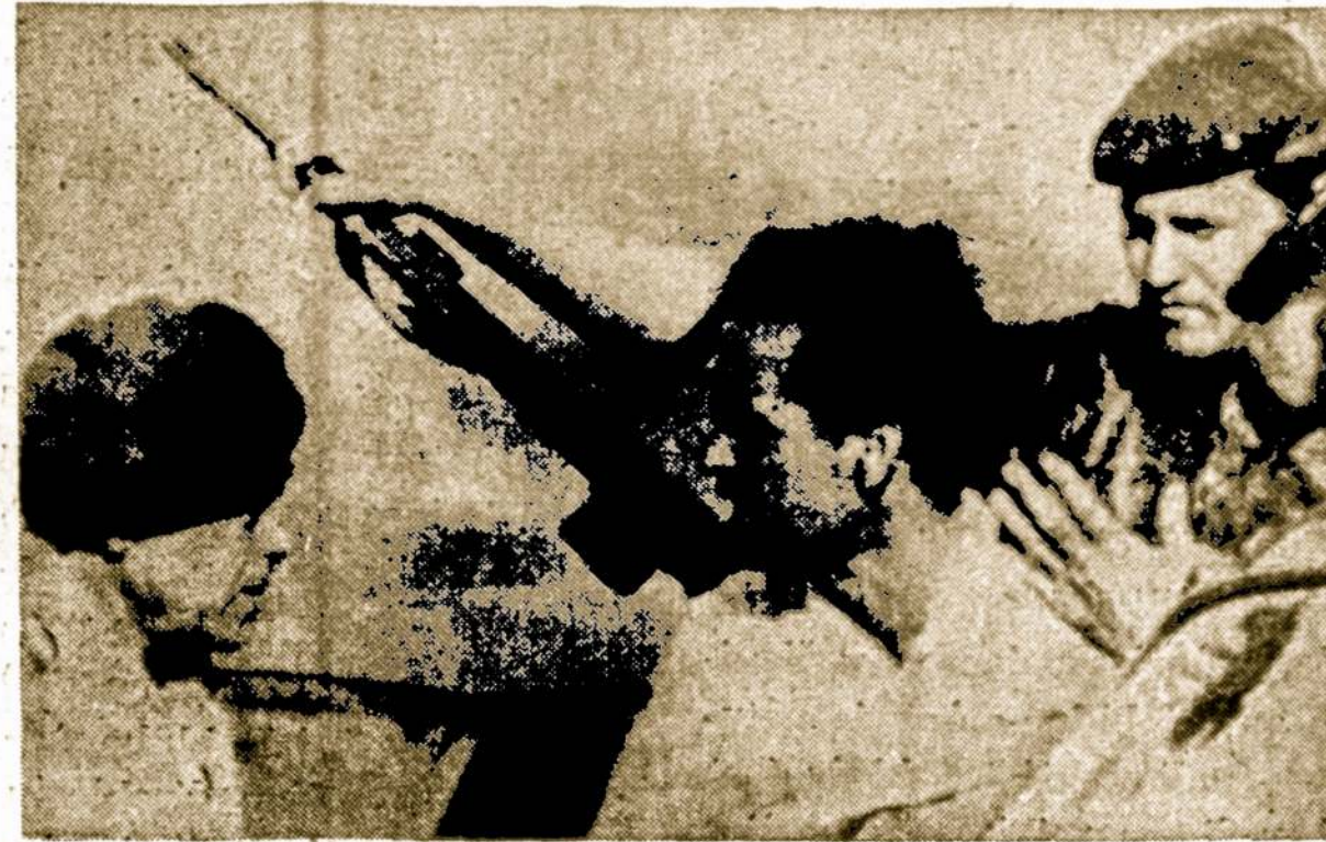
Ginklų kontrolė Lorencio Marques mieste, neramioje Mozambiko sostinėje. Kratomas automobilio vairuotojas ir jo mašina