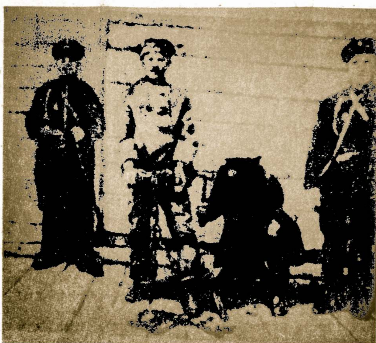
Sibiras taip, kaip jį pažįsta lietuviai. Caro žandarai užkala grandines Sibirą deportuojamam kaliniui. Ne kitaip daro ir sovietiniai rusai.

Po atentato Mitsui anoniminis informatorius patelefonoavo C. Itoh Co. firmai, išpėdamas: "Po Mitsui — jūsų ailė".