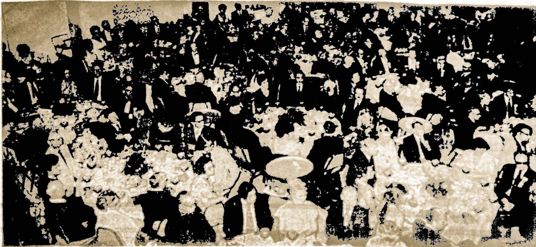
Gausūs svečiai Amerikos Lietuvių Kongreso bankete Chicagojerugsėjo 28 d. Pick - Congress viešbučio iškilnių salėje.

TESTAMENTAI Su Legaliskomis Formomis Kaina su Legaliskomis Formomis $3.50; be jų formų - $3.00. Gaunami Sandaros administracijoje.