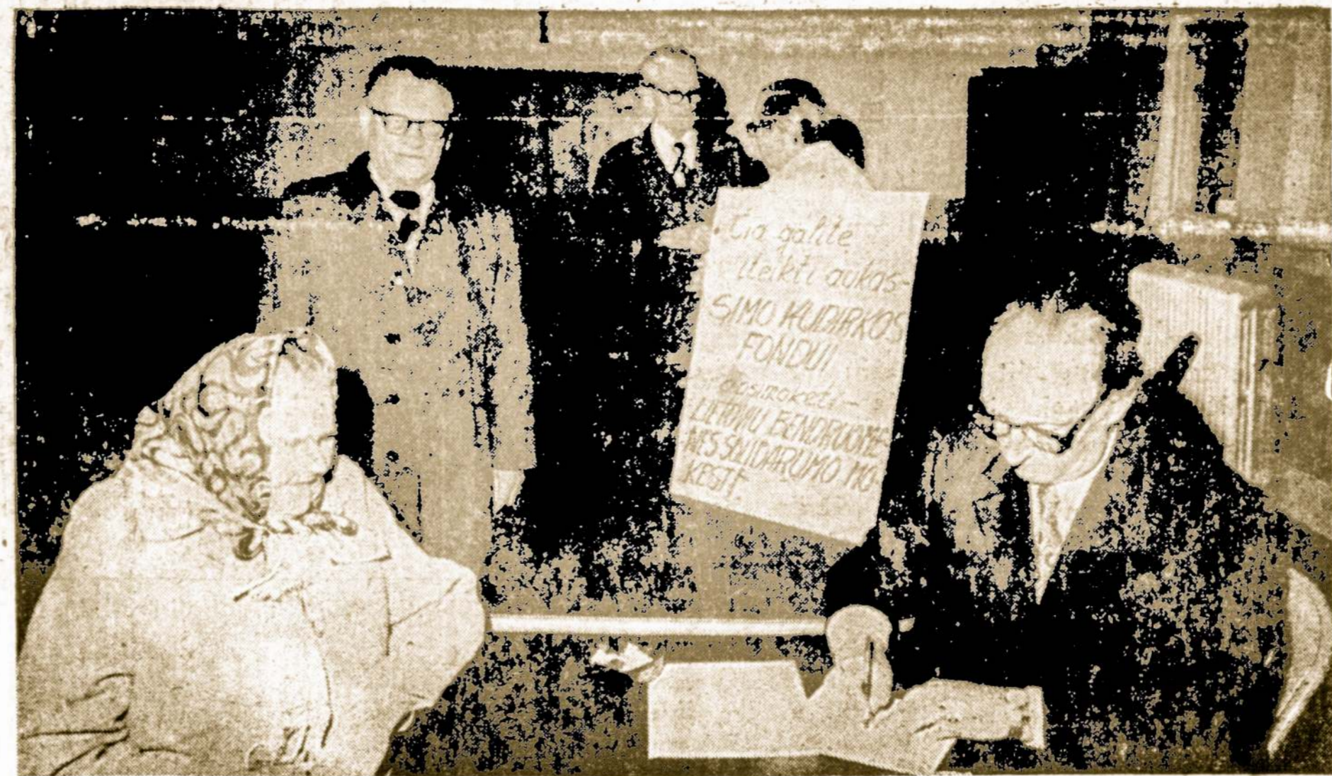
Pradėtas aukų rinkimas S. Kudirkos fondui ir buvo graži pradžia. Aukų rinkimas bus tęsiamas ir toliau. Jį praveda LB valdyba talkinama seniūnų prie visų lietuvių bažnyčių. Nuotraukoje pirmieji aukotojai Detroito.

Pirmą šiuo atžvilgiu vietą užima Olandija. Paskiau seka Vakarų Vokie-