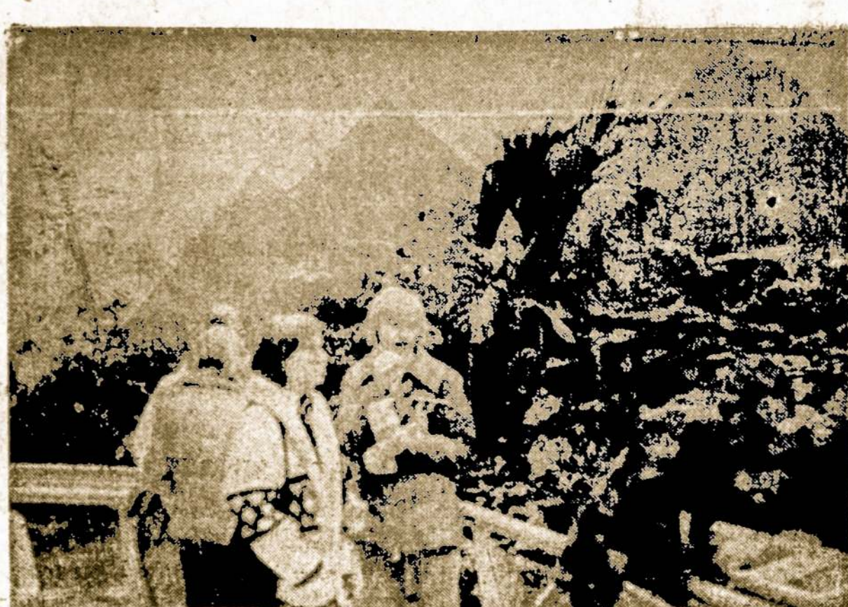
Paukščių name Brookfield zoologijos sode, Pr. Dielininkaičio kuopos ekskursijos metu.

Man, deja, reikalingas kiek laip atrodo. Reikia koncentruoti dėmesį ne tik į tai, mes ma- ame, bet nemažiau ir į tai, ką kiti mato. Vienas individas arba vienos pasaulėžiūros sambūris, dairydamas apie save, gali su sidaryti labai klaidingą eg- zistencijos bei erdvės vaizdą. Dar daugiau: gali net pats sa- vęs nematyti ir nesuprasti. Ma- tas ir dimensijos, gimusios "ma- nyje" ir "mūmyse" gali būti diametriškai priešingos tavy-