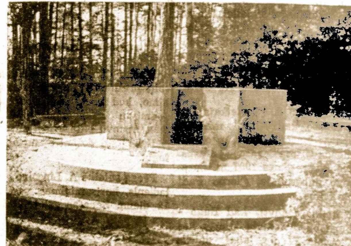
Dariui ir Girėnui paminklas Soldine, kuris dabar priklauso Lenkijai