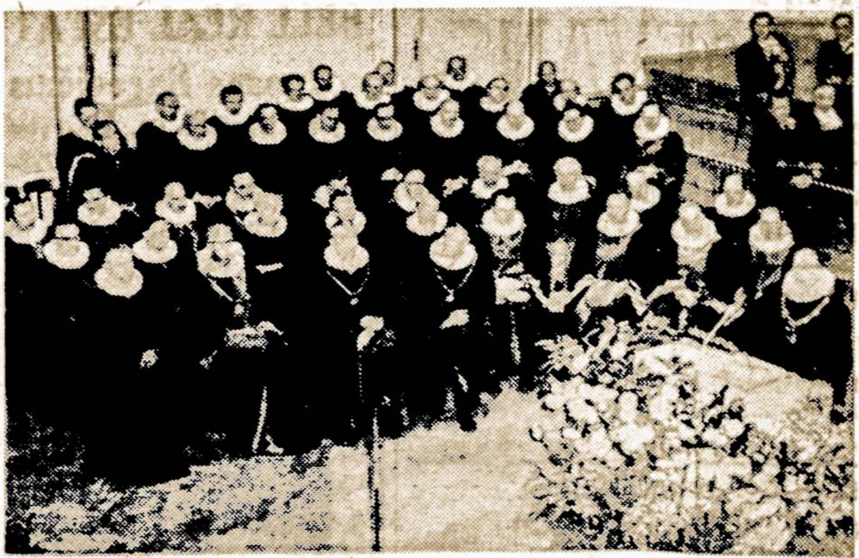
Vakarų Vokietijos senieji universitetai griežtai laikosi viduramžių tradicijų. Vieno universiteto profesoriai iškilmingose uniformose L. B. Cicero apylinkės valdybos suruošto vakaronė, sausio 11 dieną