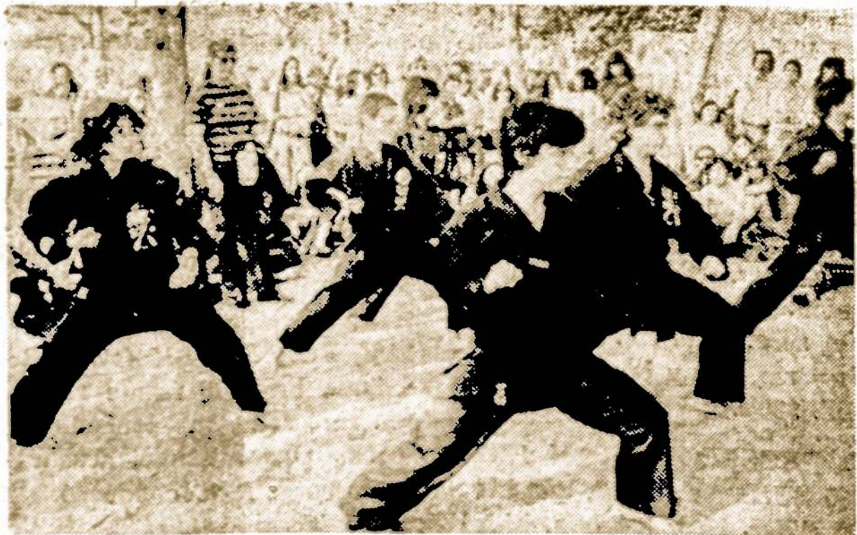
Pavojams didėjant, Amerikos moterys vis labiau ima praktikuoti japonų išgalvotą apsigynimo bei savisaugos "karati" būdą. Cia matome karati kursų lankytojas visų pratybų metu.

185 North Wabash Ave., telefon 263-5826 ir bute 877-8483