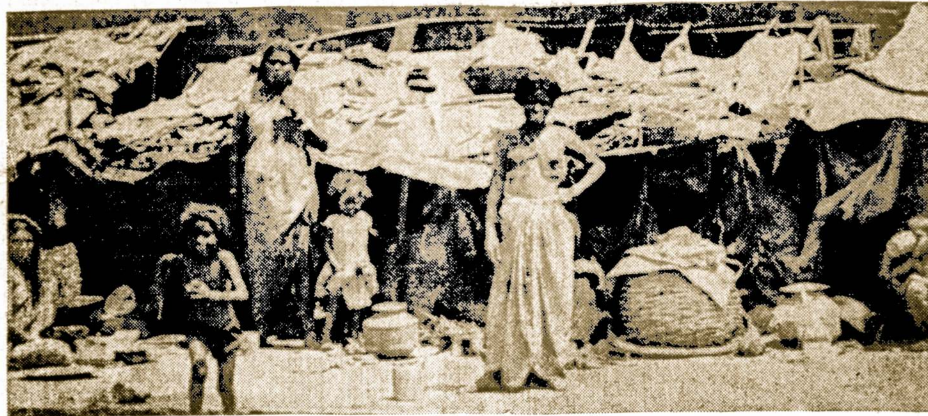
Indijoje daugelyje vietovių yra didelis skurdas