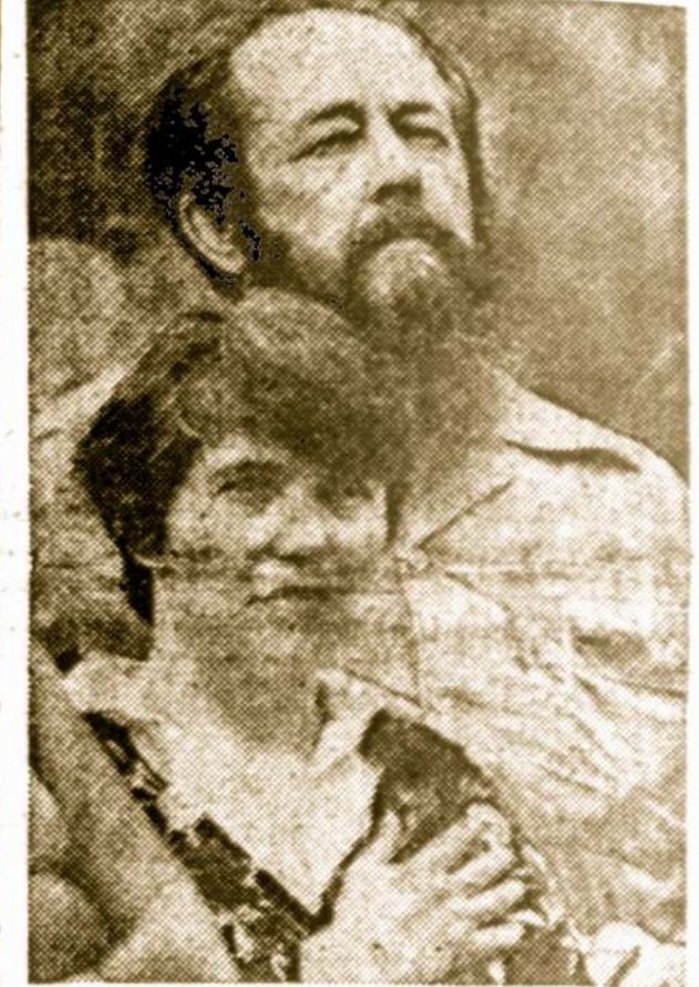
Aleksandras Solženicynas su žmona

Nuo to laiko, kai Amerika pradėjo su Sovietų Rusija va-