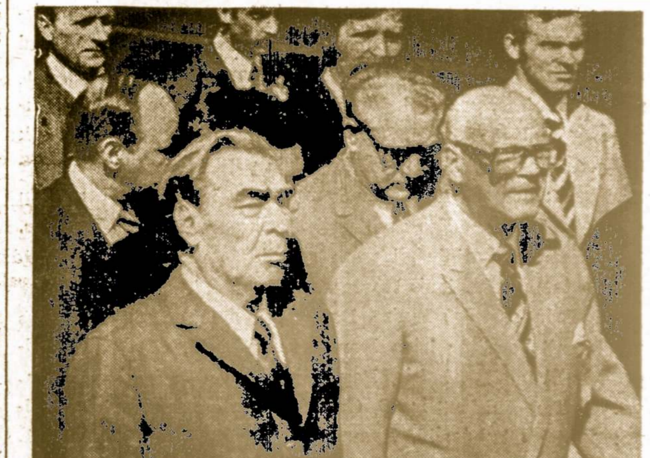
Europos saugumo konferencijos metu Helsinkyje Suomijos prezidentas Kekkonen (dešinėje) sutinka ir pagerbia konferencijos didžiausią laimėtoją L. Brežnevą

Cook apskrityje atrasti 6 nauji susirgimai miego liga, bet pašėbėta, kad susirgimai šia liga Illinois valstijoje eina mažyn.