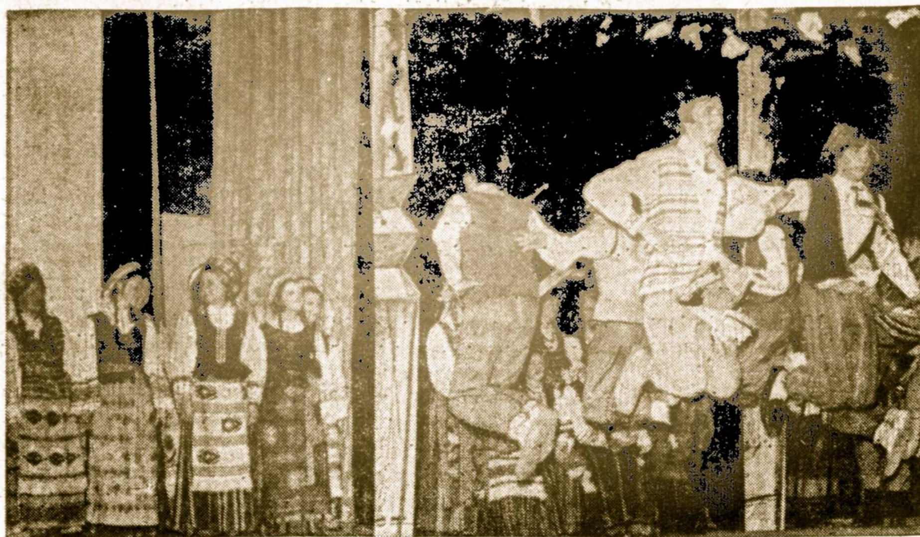
Grandies ansamblio valdyba informuoja, kad Grandies ansamblio šokėjų registracija įvyks rugsėjo 4 d., 7 val. vak. Jaunimo centre. Tą dieną bus priimami ir nauji šokėjai.

Degant namui 1154 N. La Salle, Chicagoje, žuvo Cl. Miller, 48 m., ir viena moteris, sudėgusi kad jos neįmanoma atpažinti. Atvykę ugniagesiai jautė gazolino garus ir įtaria, kad tai buvo padegimas.