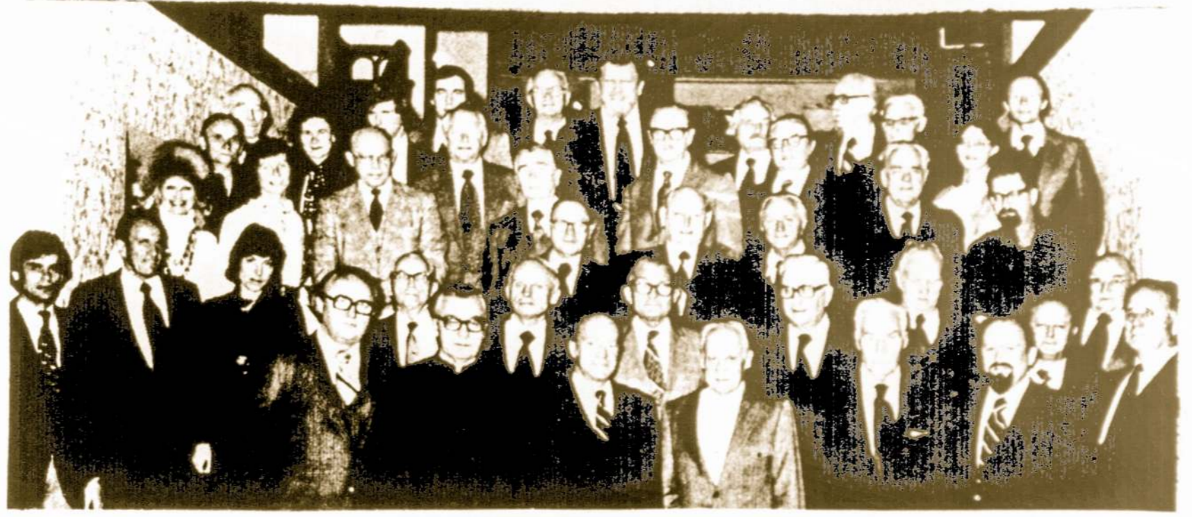
Vyriausio Lietuvos Išlaisvinimo Komiteto Sėimo, įvykusio 1976 m. gruodžio 4-5 d. d., Shoreham Americana viešbutyje, Washington, D. C., atstovai ir svečiai . Nuotrauka L. Tamošaičio

SOCIALIZMO KLAUSIMU. 1916 m. Sandara laikė socializmą (tiksliau, mark-sizmą) gryna teorija, idėja, nes kaip ir kokių turiniu turi būti socialistinė san-tvarka nėra aišku net socialistų ideolo-gų tarpe. Sandarai rūpėjo, kaip matyti iš programos, ne skambios frazės ar re-voliucinga retorika, o "didžiausio žmo-nių skaičiaus aukščiausiai galima gero-vė ir tobulybė - ir to užtenka".