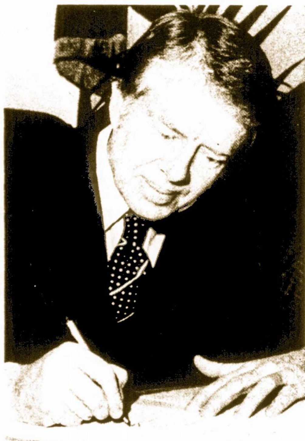
First official business: President Carter signs papers in a Capitol office, formally nominating his Cabinet team.

Išėjęs į privatų gyvenimą G. Fordas mano verstis advokatura ir rašyti atsiminimus, ypač paliečiant aplinkybes, įskiriančias viceprezidento postui. Gana daug vietimų G. Fordas gavo iš įvairių universitetų, kviečiančių jį politinių mokslų lektoriui. G. Fordas žada keltis gyventi į Kaliforniją.