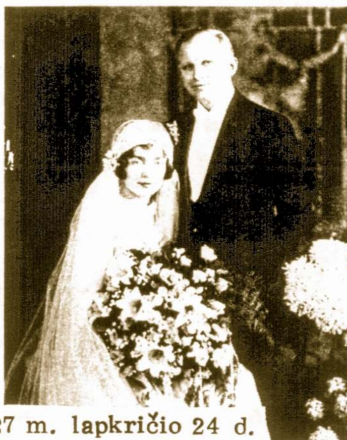
1927 m. lapkričio 24 d.