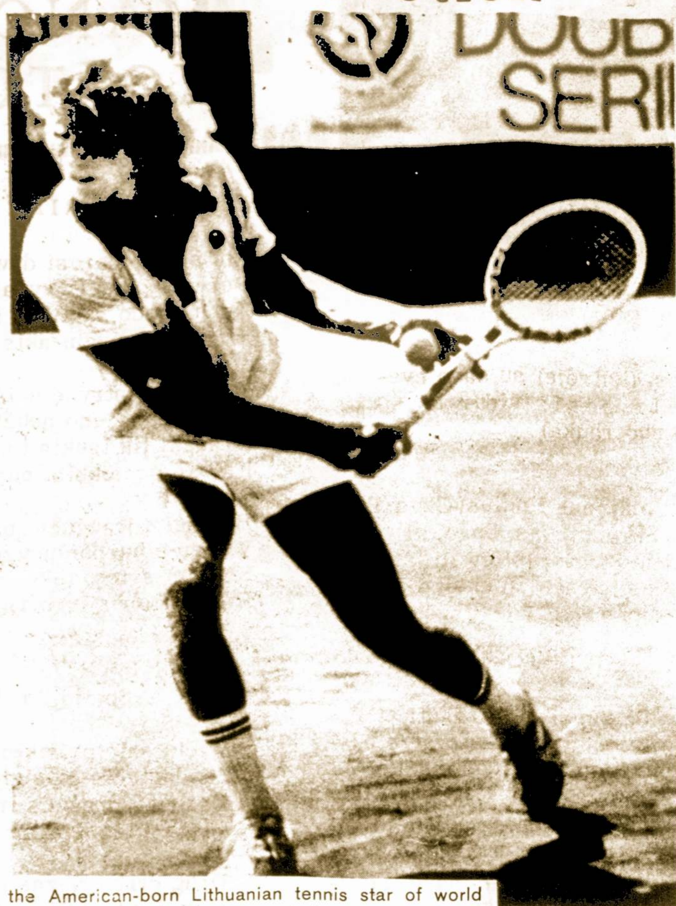
Vitas Gerulaitis, 23, the American-born Lithuanian tennis star of world fame, winner of Italian championships in 1977, and the heroic quarter-finalist of the Wimbledon Centennial games. He is presently achieving great success in his Australian championship tour.