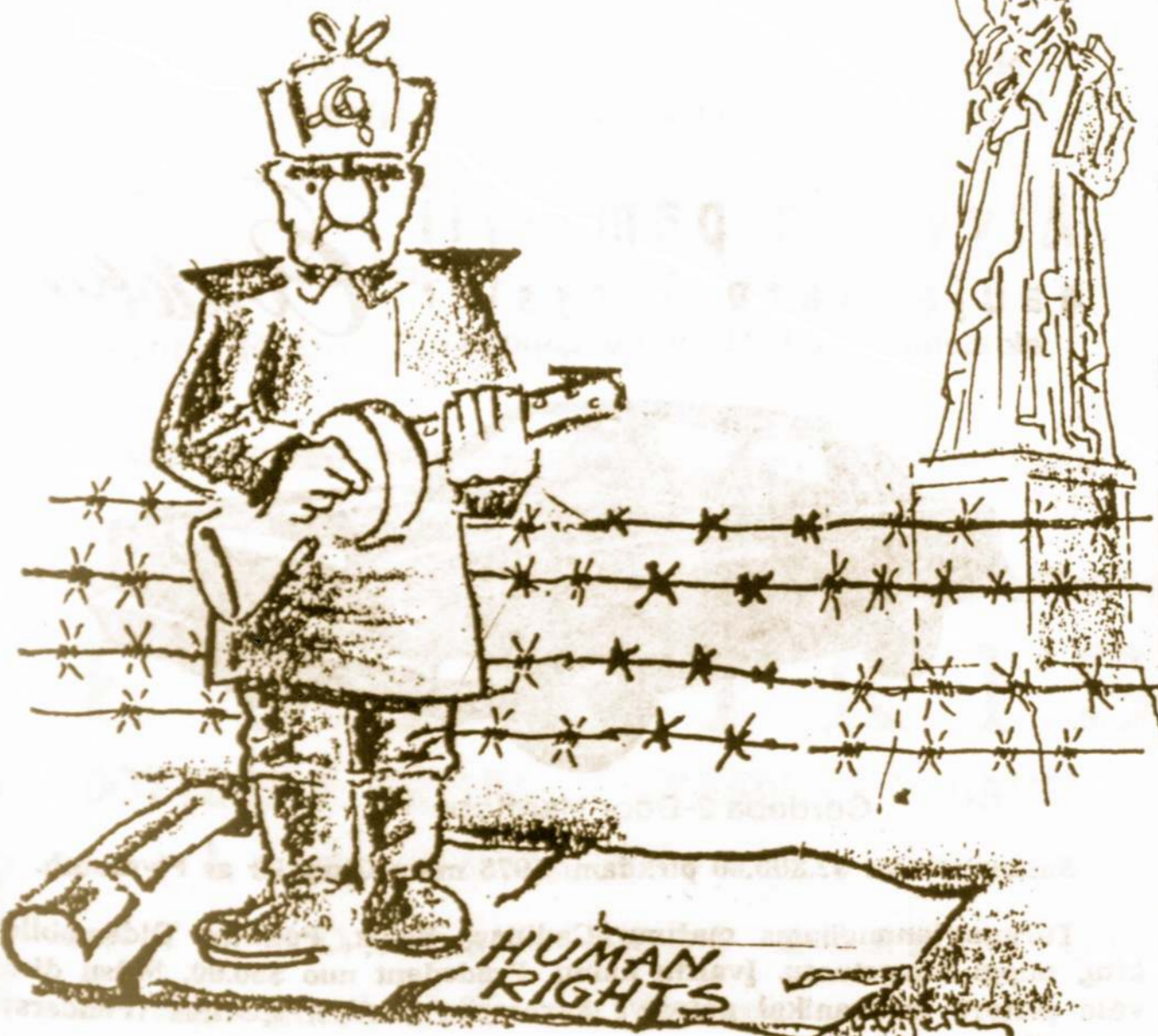
AIŠKU IR BE PAAIŠKINIMŲ... (Dail. V. Vijeikio karikatūra, daryta 1970 m., Sandaros "dailininkų" perdirbta ir pritaikyta dabarčiai)