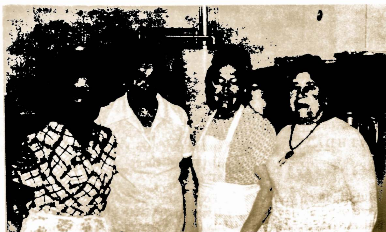
SANDAROS GEGUŽINĖS ŠEIMININKĖS, skaniai vaišinusios visus svečius iki soties.