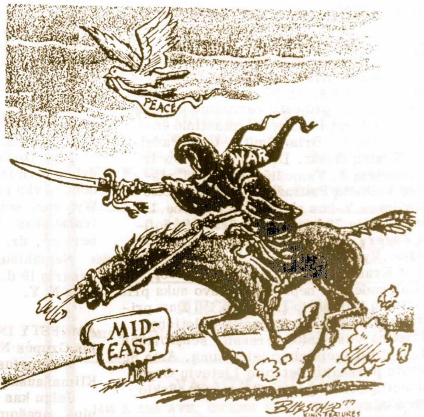
TAIKOS BALANDŽIO LENKTYNĖS SU ŠĖTONU