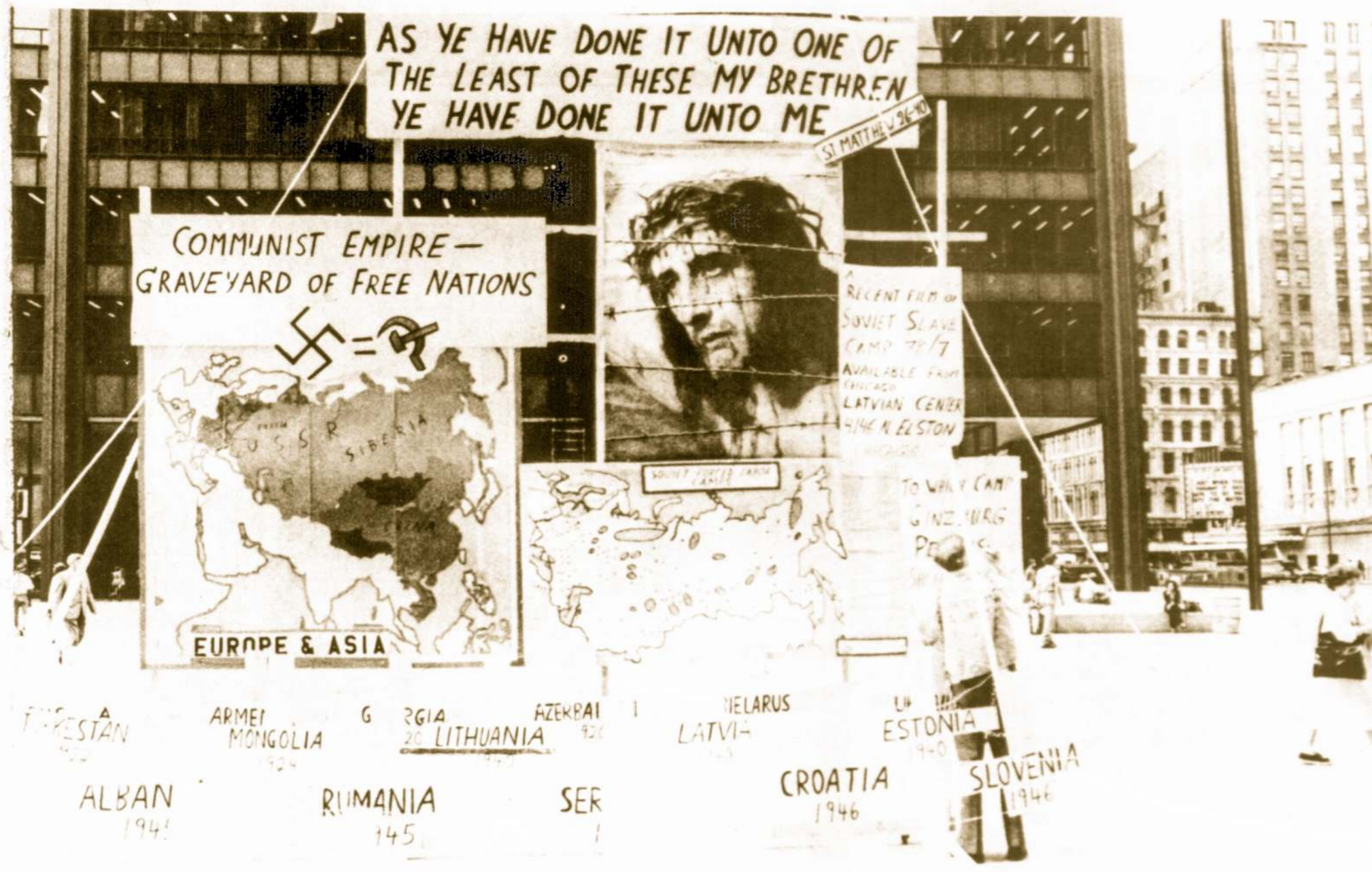
PAVERGTŲ TAUTŲ MINĖJIME š.m. liepos 14 - 15 dd. Chicagoje, mayoro R. J. Daley vardo aikšteje stovėjo pastatytas šis didžiulis paveikslas.

Be to, tam sąraše yra 8 asmenys, kurie vyksta daugiausia iš Maskvos į Izraelį. Senatorius pažymi, kad šie asmenys nebuvo gavę išvažiuoti leidimo per aštuonis ar daugiau metų, nors buvo prašyta pakartotinai net keletą kartų.