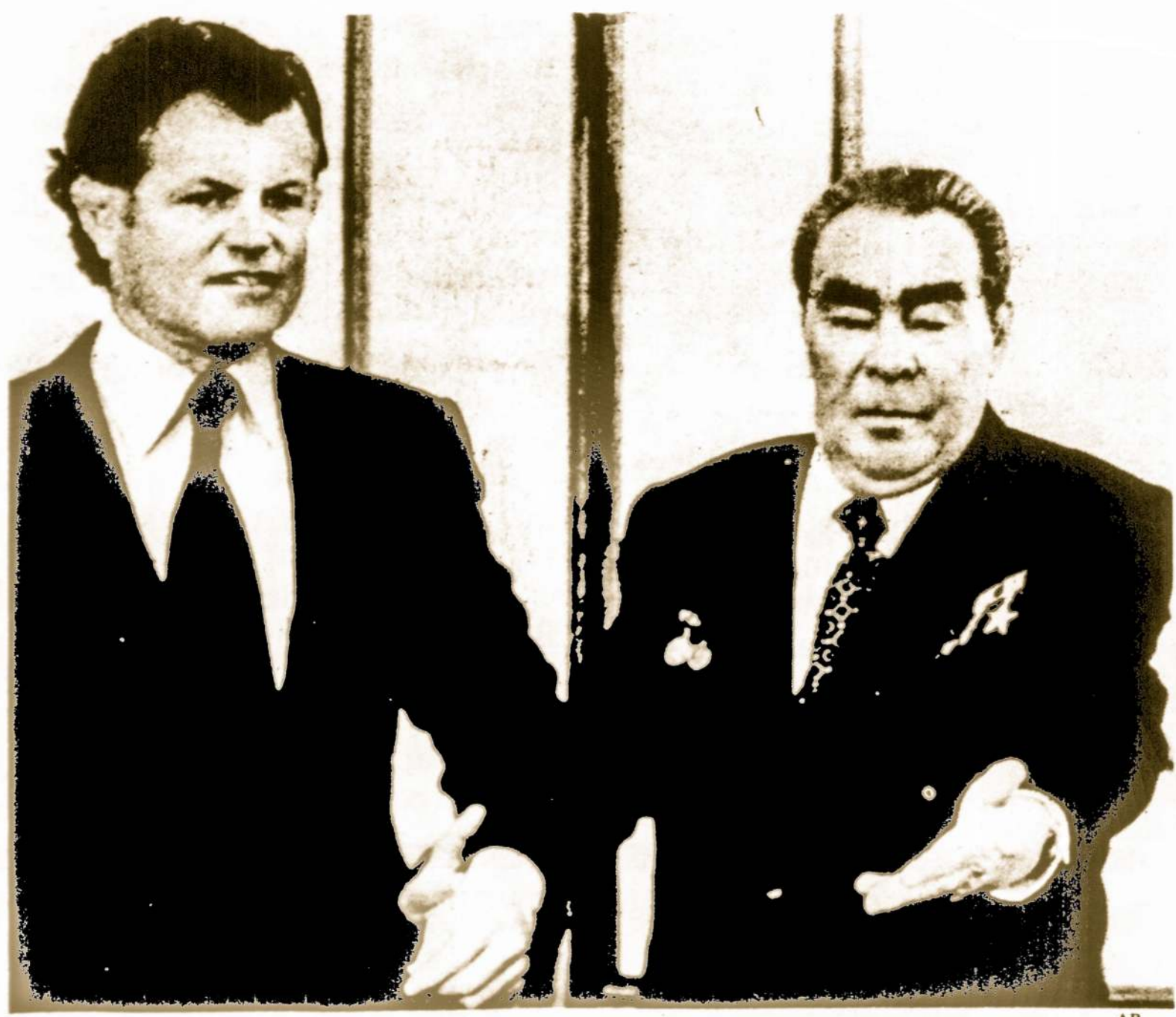
SEN. EDWARD M. KENNEDY SUSITINKA SU BREŽNEVU

Indijoje dvi šventosios upės Ganges ir Jamuna dėl potvynių sudaro pavojų dviem, taip pat laikomiems šventaisiais miestams - Banares ir Allahbad. Pirmojo miesto prekybos centras atsідūrė 6-9 pėdų vandens gilumoje. Taip pat gresia pavojus ir kitam miestui, jei neatlaikys prieš potvynius pastatytas 400 metų pylimas.