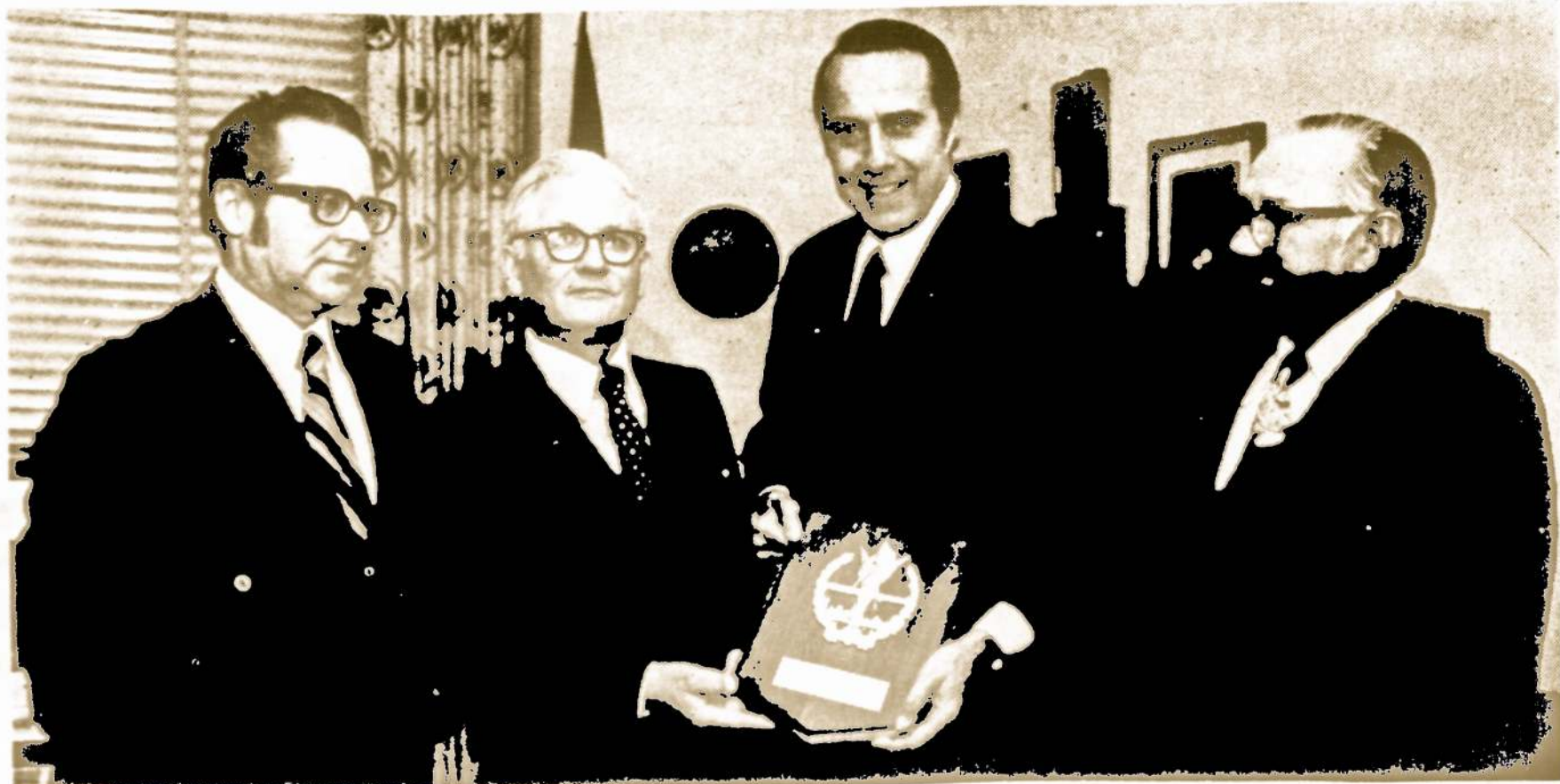
Senator R. Dole, Rep., Kansas, one of America's representatives at the European Security Conference in Belgrade in 1977-78, receives a commemorative plaque from the American Lithuanian Council for his efforts in protecting the national and human rights of suppressed Lithuanians.