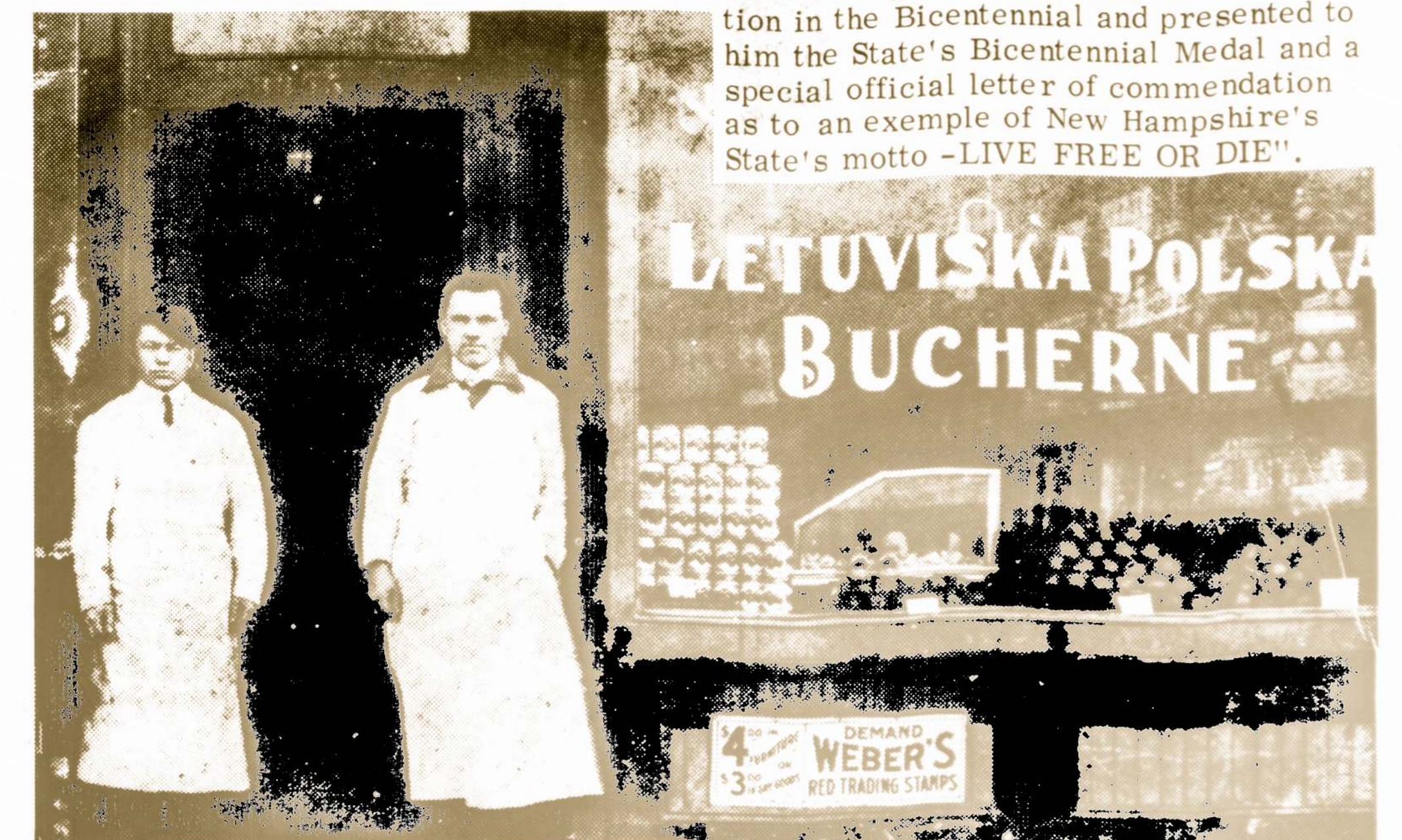
The February 13, 1978 edition of Newsweek carried a full page ad as a public service of the Advertising Council. Called "How we sweetened the melting pot", this advertisement for US Savings Bonds carried a turn-of-the-century photograph of a Lithuanian immigrant's butcher shop. (The window sign "Lietuviska Polska Bucherne" is Volgate Lithuanian for "Lithuanian - Polish Butcher's Shop"). The BRIDGES editors have identified this picture as a view of the Old Bridgeport, Chicago Lithuanian Community.