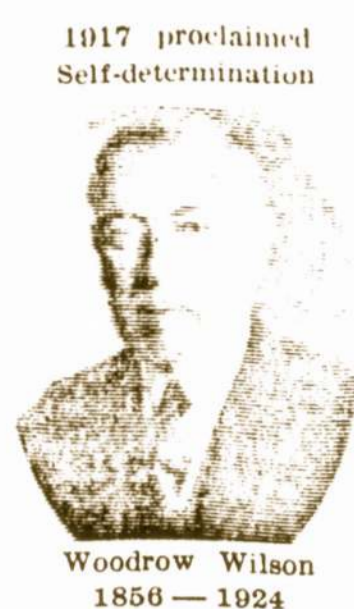
1917 proclaimed Self-determination Woodrow Wilson 1856 — 1924

Why do these journalists not write about the communist atrocities carried out today in Cambodia, Viet Nam, Laos, about the continuing genocide in Lithuania, Latvia, the Ukraine for the last 38 years, about the illegal occupation of the Baltic States, about the tragedy of 100,000 Lithuanians deported to Siberia during one night, about the murder of