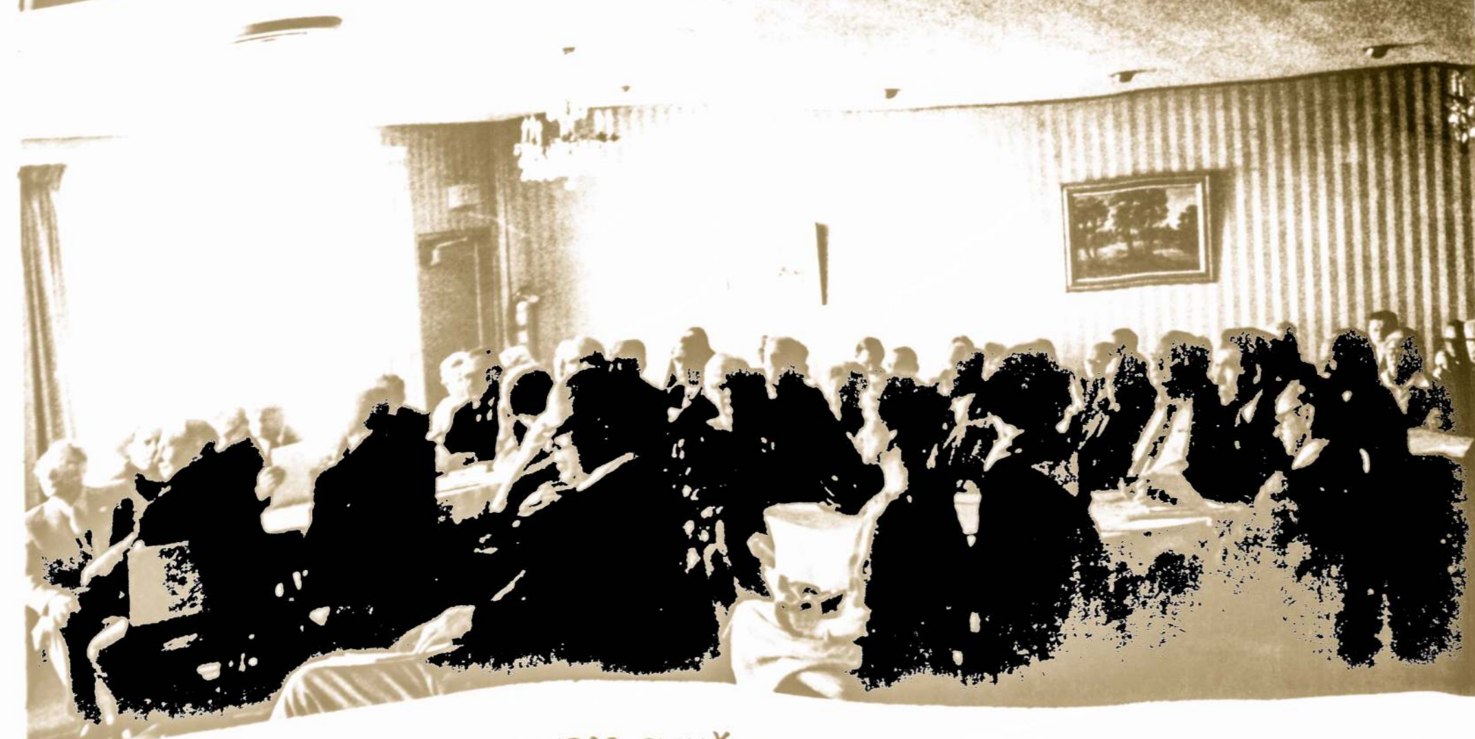
AMERIKOS LIETUVIŲ TARYBOS SUVAŽIAVIMO, įvykusio 1978 m. spalio 21 d. Lietuvių Tautiniuose Namuose, Chicagoje, DALIS DALYVIŲ.