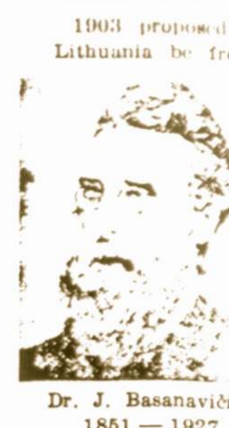
1903 proposed Lithuania be free Dr. J. Basanavicius 1861 — 1927

2649 West 63rd Street CHICAGO, ILLINOIS 60635 60629 Telephone: PR. 6-5162