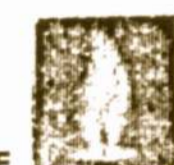
FLAME OF FREEDOM