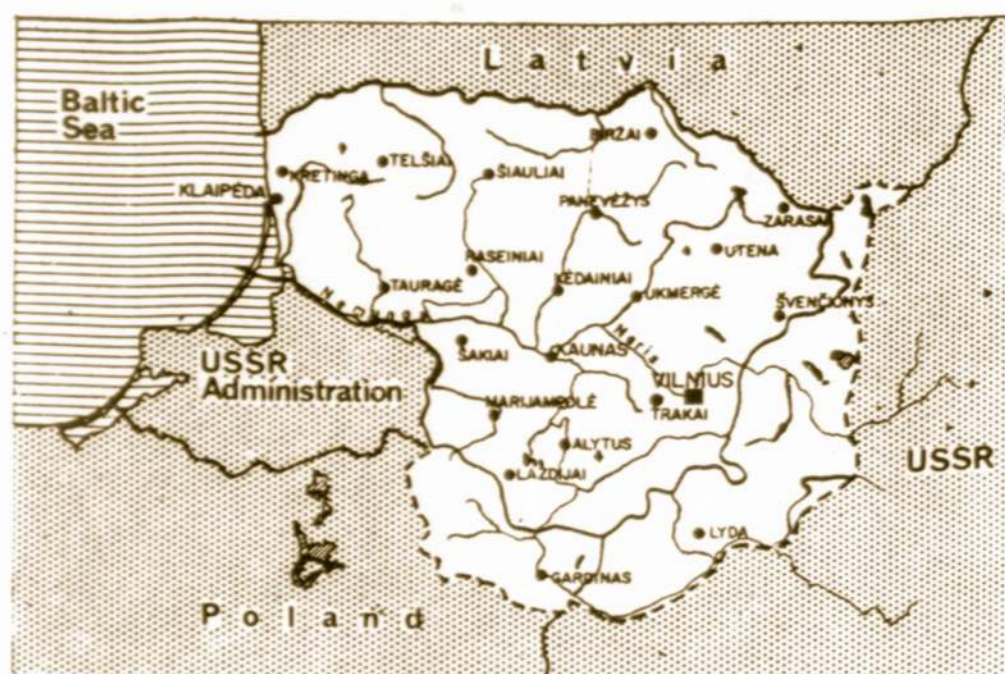
Map of Lithuania. Dotted line: the border established by the Lithuanian-Soviet Peace Treaty of 1920.

In our hearts, Lithuania, Love for you will dwell fore'er Spirit of the world is soaring - Caught in your exalted glare.