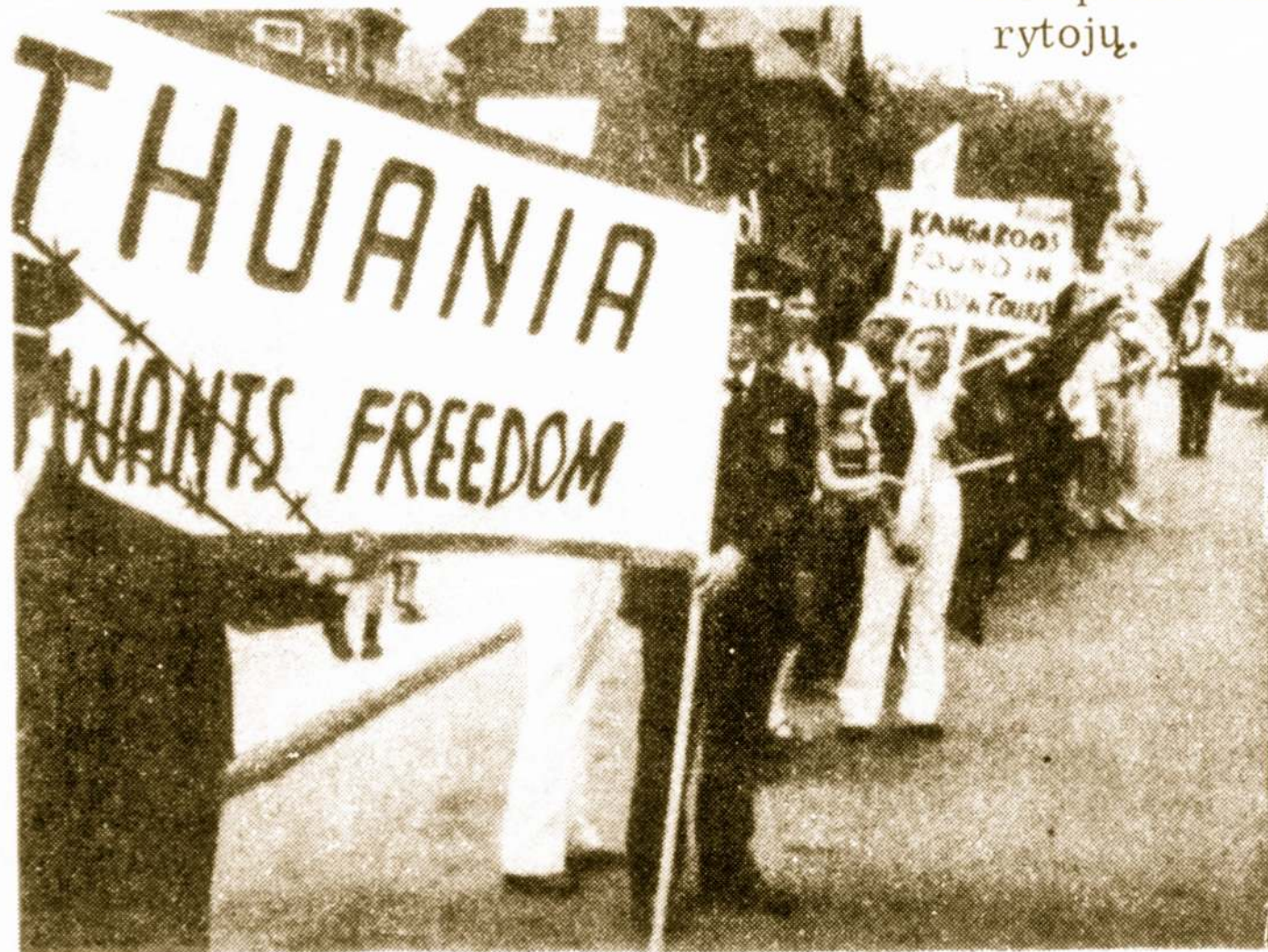
Kanados lietuvių demonstracijoje Otavoje Montrealio šauliai su plakatu "Lithuania wants freedom" ir kiti demonstrantai prie Sovietų Sąjungos ambasados birželio 10 dieną. Toliau matyti daugybė kitų plakatų

1978 m. gruodžio 1 d. sovietinė "Pravda" paskelbė naujo sovietų pilietybės įstatymo tekstą, pagal kurį nuo liepos 1 dienos beveik visa išėivija bus skaitoma sovietų piliečiais, skaitant mūsų vaikus ir vaikų vaikus. Norint atsakyti primestos sovietinės pilietybės, reikia gauti aukščiausiojo Sovieto prezidiumo sutikimą. Žinoma, atsisakydami nepageidaujamos pilietybės kartu patys pripažintume, kad buvome priėmę šią tariamą pilietybę.