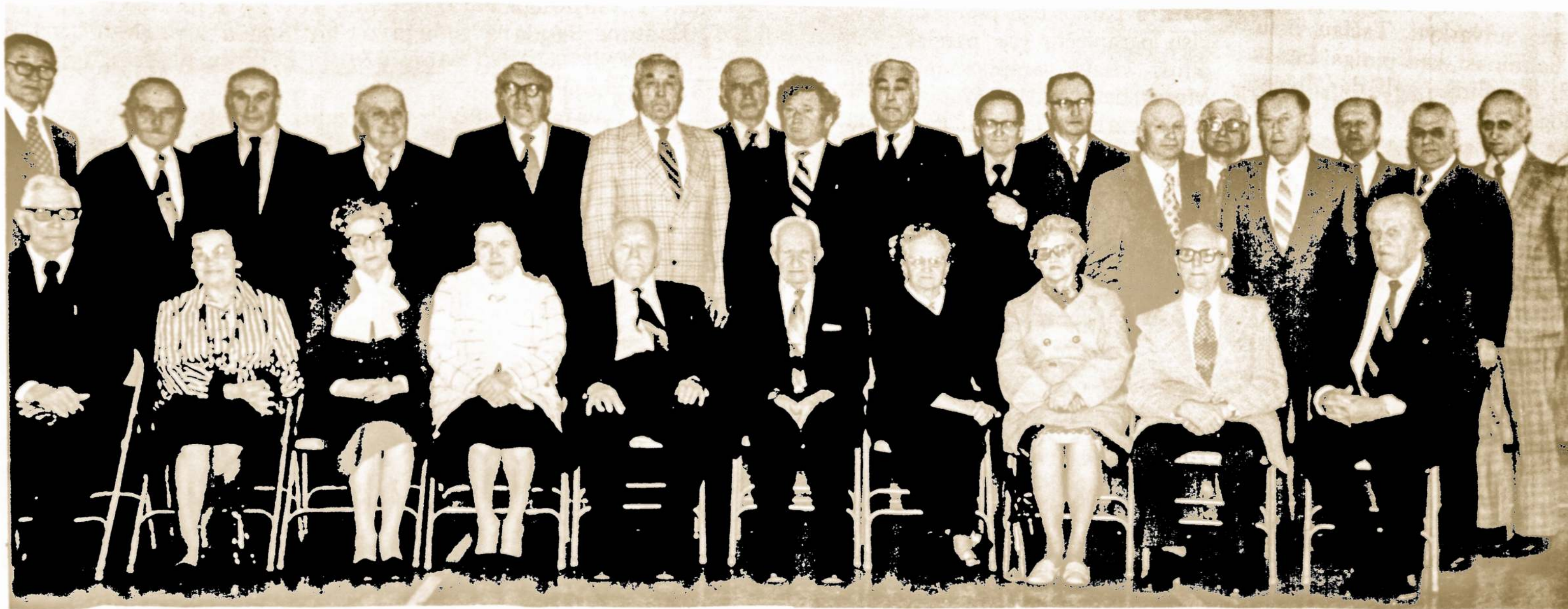
BALFO CHICAGOS PENKTOJO SKYRIAUS METINIO SUSIRINKIMO DALYVIAI MARQUETTE PARKO PARAPIJOS SALĖJE