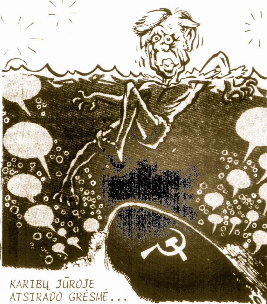
KARIBŲ JŪROJE ATSTRADO GRĖSMĖ...

Afganistano pasienyje telkiama sovietų kariuomenė. matomai, besiruošianti gelbėti jų primestą režimą. Amerikiečių vyriausybė pasiuntė sovietams notą, įspėjantią laikytis nuošaliai nuo afganistano įvykių.