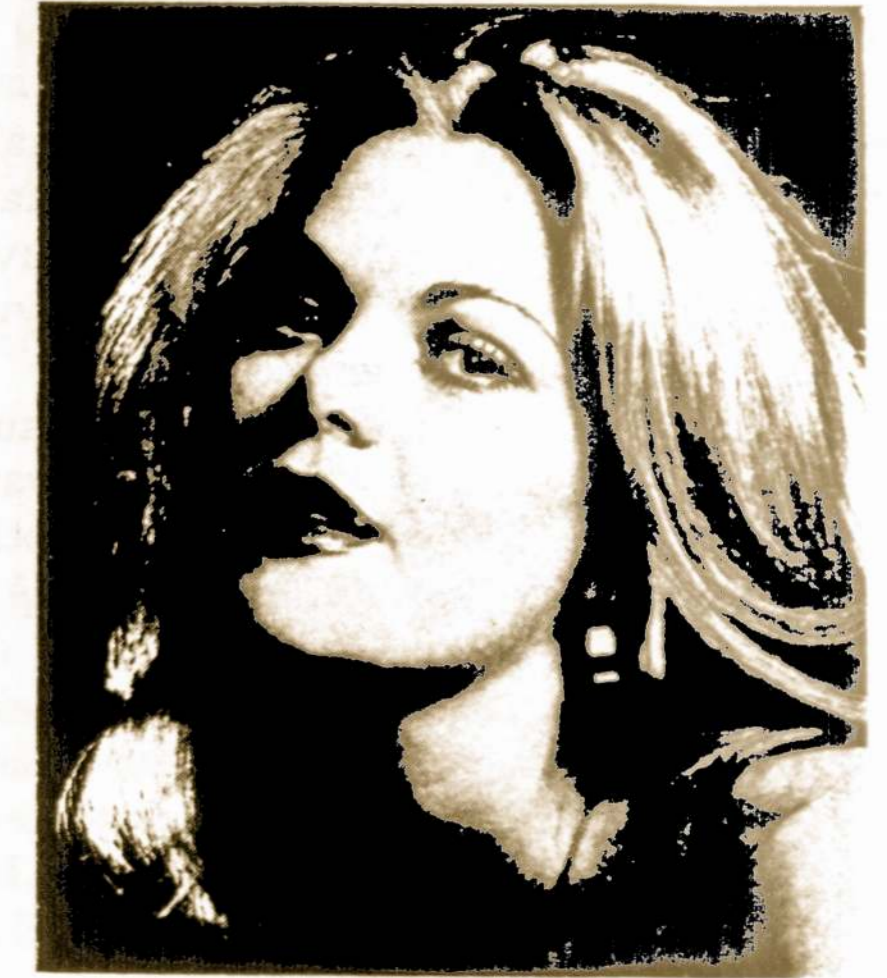
Ann Jillian today. Ann Jillian — Jūratė Nausėdaite dabar.

A 135 pound 5-foot 8-inch honey blonde, she is cast as a dumb-blonde who manages to perform the role with class and savvy. Reviewers all take note of this budding talent, commenting on her finely-tuned ability in song and dance. For this Ann Jillian gives credit to her mother who "made everything I needed available to me," like the 14 years of singing and dancing lessons. Also, in 1971-72 Jillian was awarded a full scholarship with the Los Angeles Civic Light Opera Association providing her with the opportunity to study with the finest teachers in the country. Now, Mickey Rooney acting as her personal manager, we anticipate she will be catapulted into stardom.