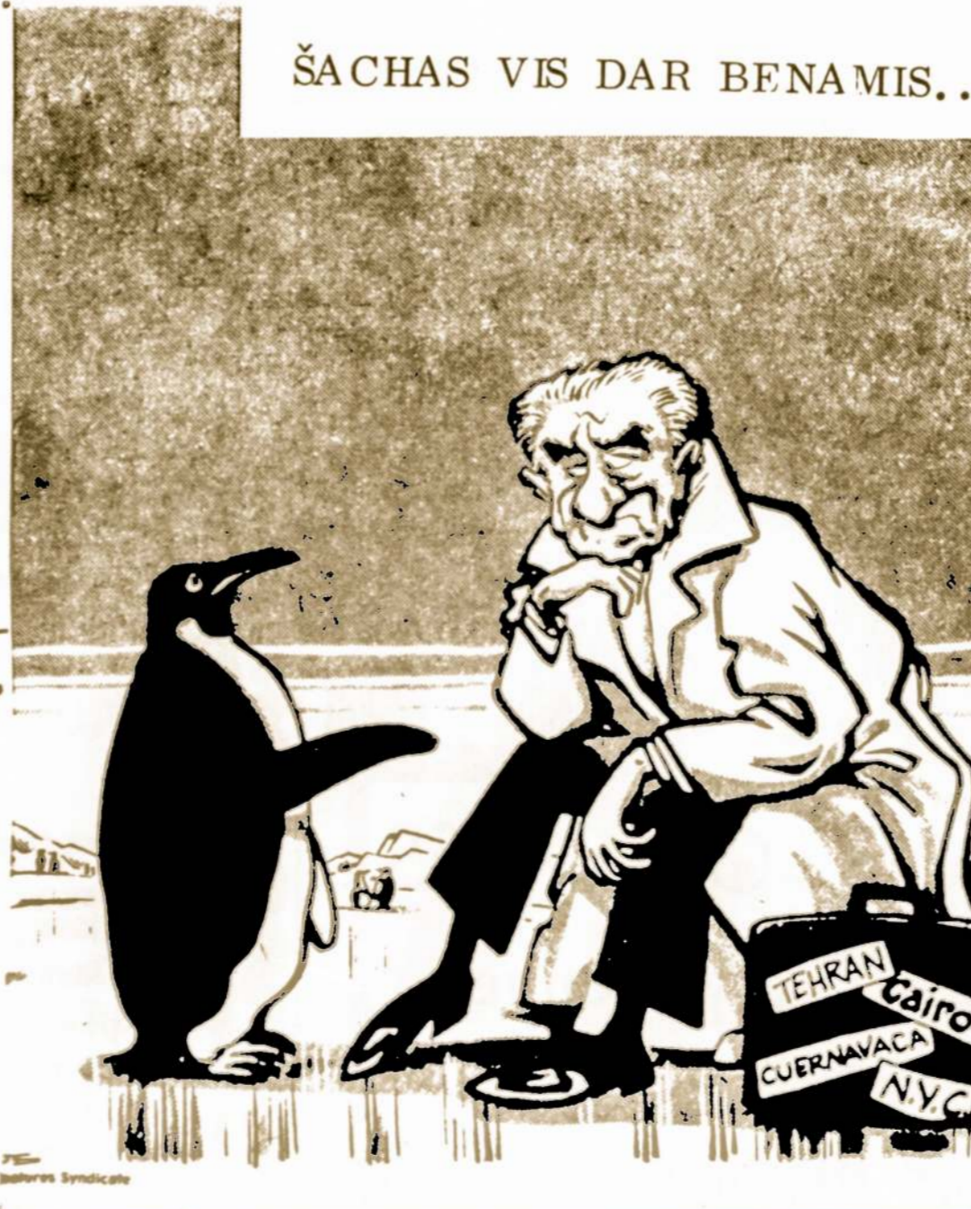
ŠACHAS VIS DAR BENAMIS.

New Yorke mirė arkivyskupas Fulton J. Sheen, sulaukęs 84 metų. Mirė ištiktas širdies smūgio. Velionis buvo garsus su nuolatinėmis radijo ir televizijos programomis, kurių pastoviai klausėsi apie 5 mil. žmonių. Velionis buvo gimęs Illinois ūkininkų šeimoje.