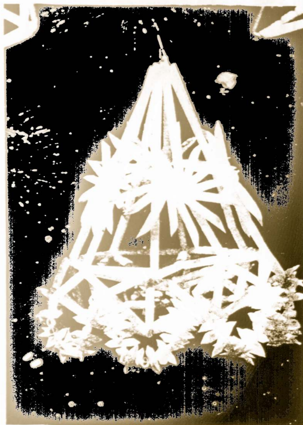
One of many intricate straw ornaments made by BERNICE KASARSKI. It takes several hours to make one.