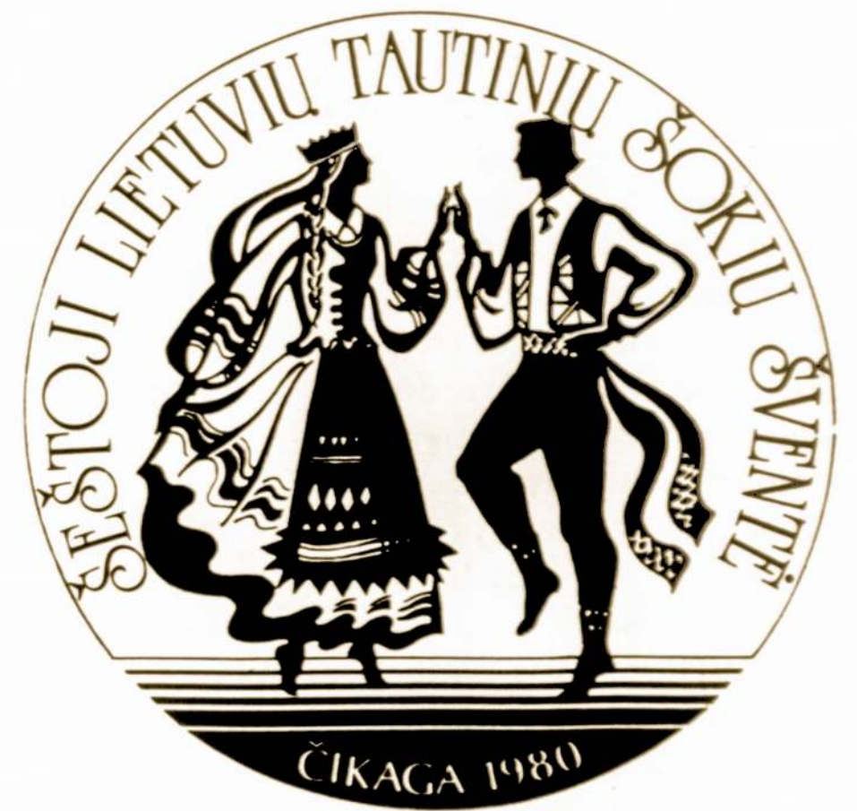
Ženkliuko projektas: dail. A. SUTKUVIENĖS

Stalai po 10 žmonių. Bilietus užsakant paštu, čekius rašyti: Lithuanian Folk Dance Festival.