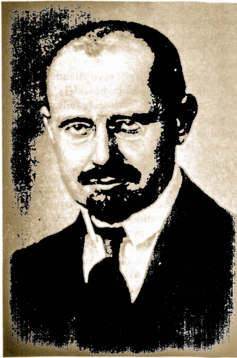
ALEKSANDRAS STULGINSKIS 1885-1969

Šių metų gegužės 15 dieną suėjo 60 metų, kai Kaune rinkosi LIETUVOS STEIGIAMASIS SEIMAS. Steigiamasis Seimas 1920 m. birželio 2 d. priėmė LAIKINĄJĄ KONSTITUCIJĄ. Birželio 19 d. A.Smetona perdavė Lietuvos Prezidento pareigas St.Seimo pirm. A.Stulginskiui, Dr.Kazys Grinius sudarė Ministerių Kabineta.