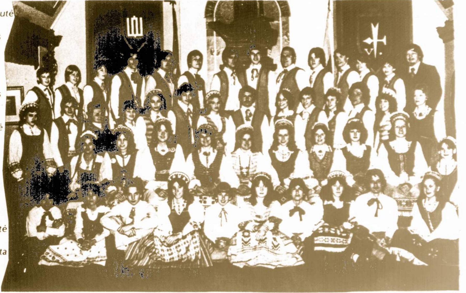
Bostono Lietuvių Tautinių Šokių Sambūris Boston, Mass. Jaunių šokėjų grupė