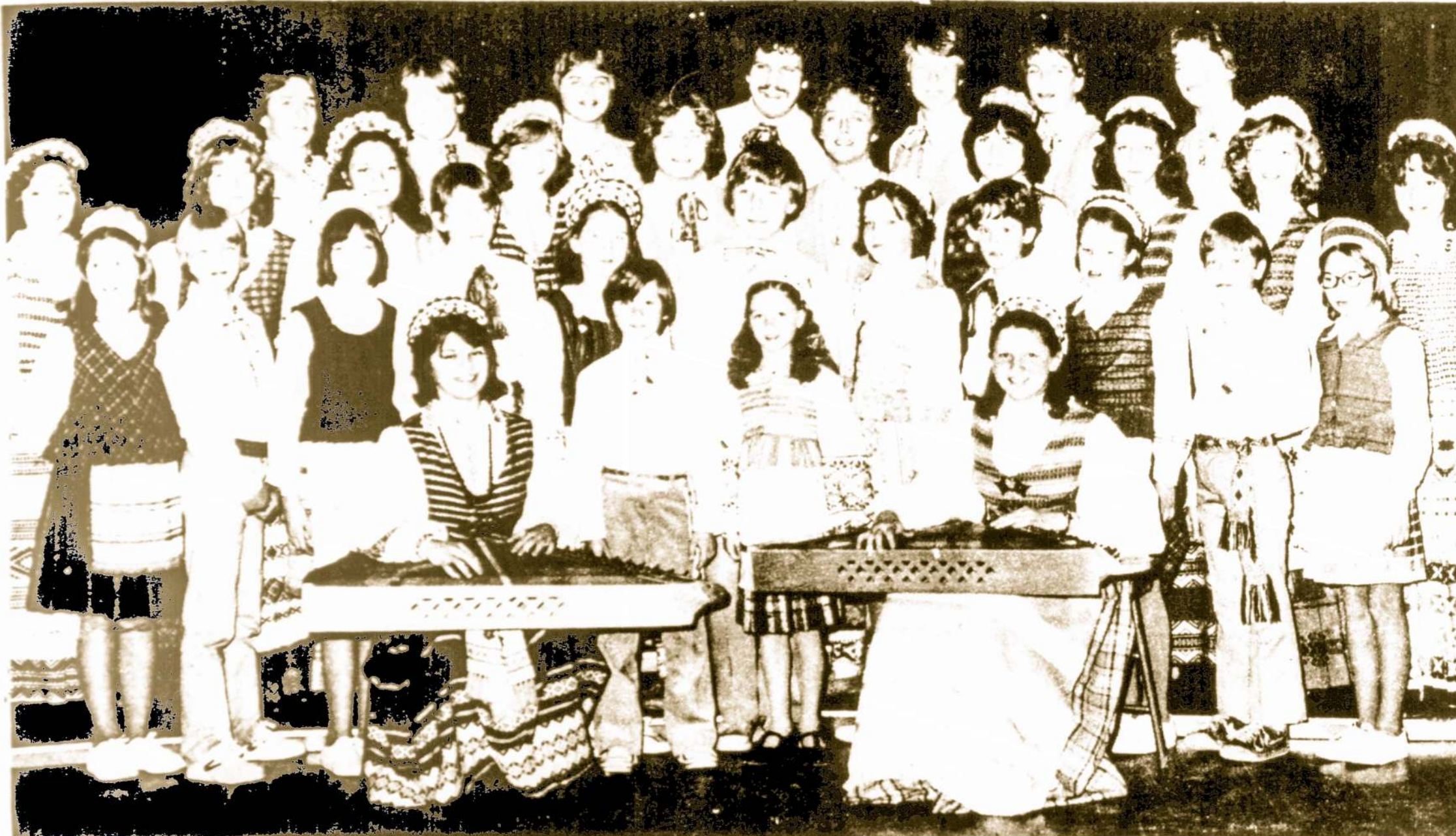
SŪKURYS, Brockton, Mass., tautinių šokių grupė dalyvaus VI Taut. Šokių Šventėje.