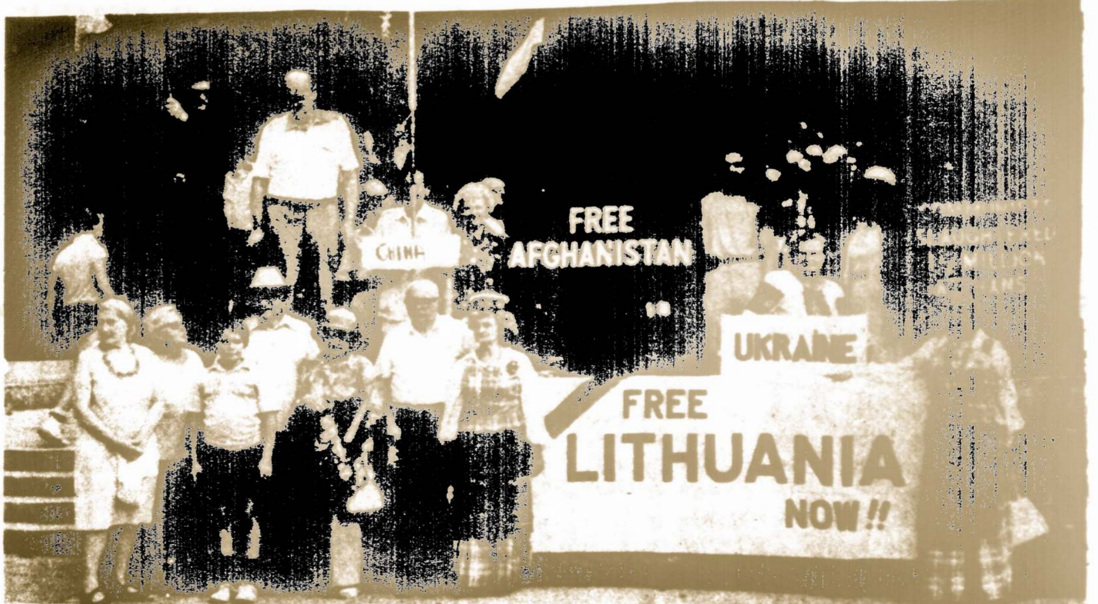
PRIE LAISVĖS STATULOS N.Y. grupė lietuvių Pavergtųjų Tautų Savaitės proga, 1980 m. liepos 20 dieną. Padėtas vainikas.