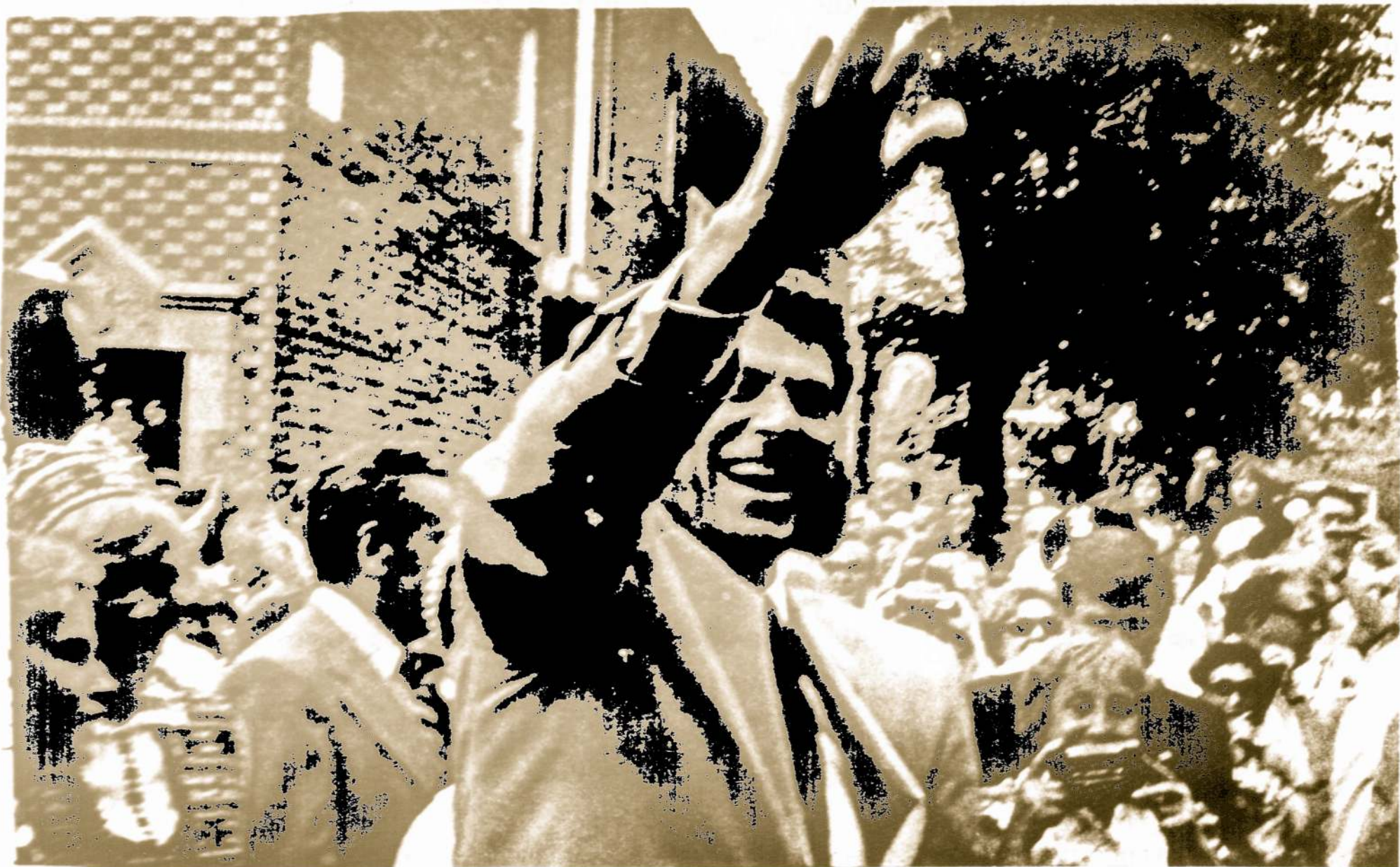
GUBERNATORIUS RONALD REAGAN - Respublikonų kandidatas į Amerikos prezidentus, sutinkamas su entuziazmu Chicagoje, Marquette Parko rajone - Lithuanian Plaza Court. Dalyvavo tūkstančiai lietuvių ir šiaip apylinkės gyventojų.