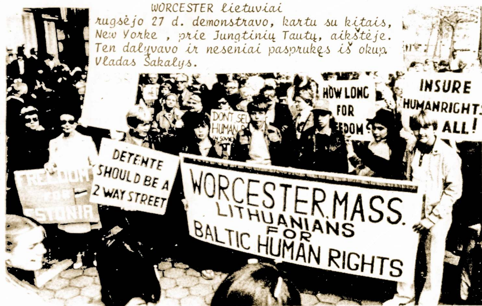
Demonstruotojai su plakatais reikalauja Lietuvai, Latvijai ir Estijai laisvės.

Opinions expressed in any column appearing in the SANDARA, including those of staff members, reflect the views of the writer only. The opinions may or may not be in agreement with those of the Lithuanian National League of America.