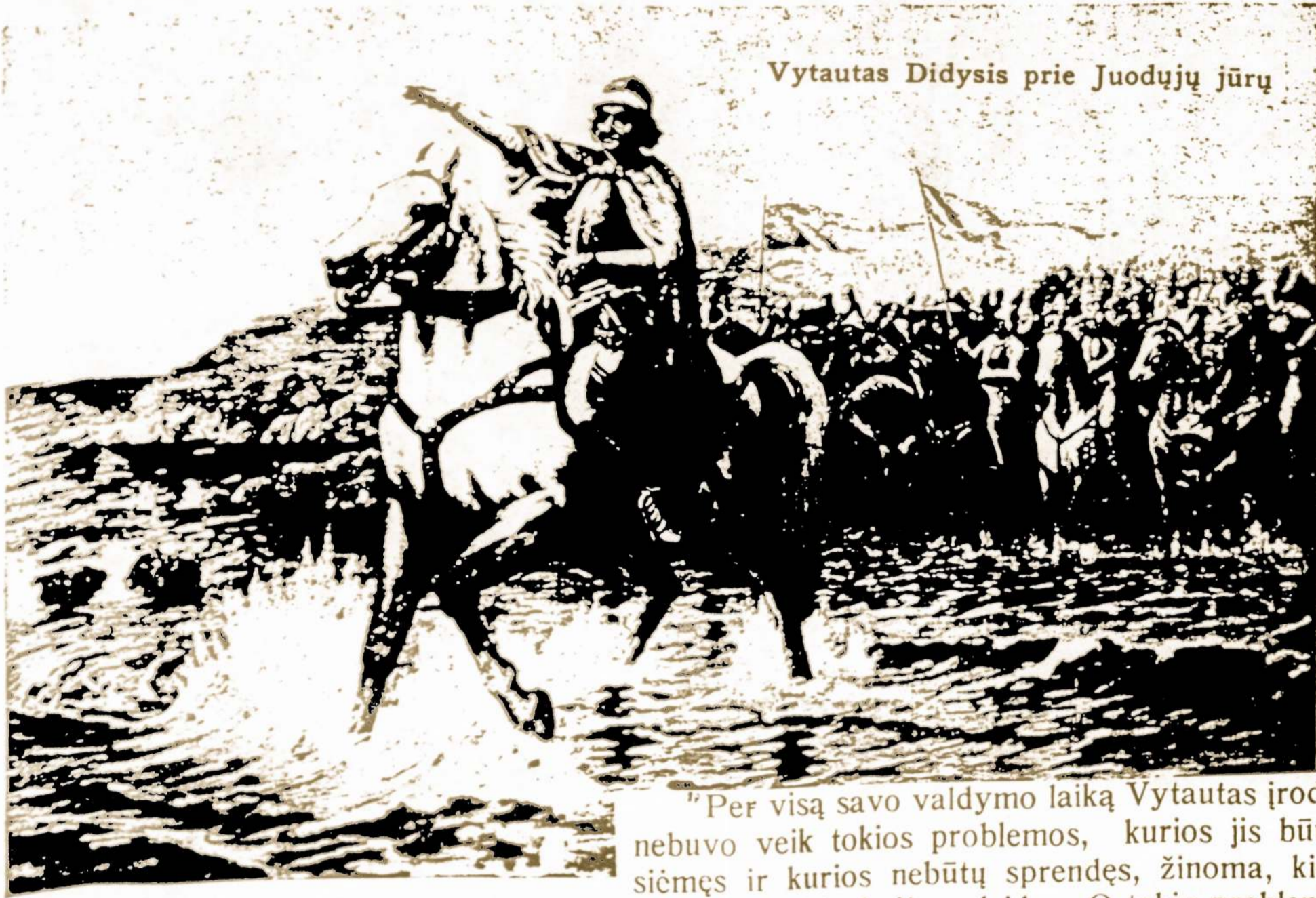
Vytautas Didysis prie Juodųjų jūrų