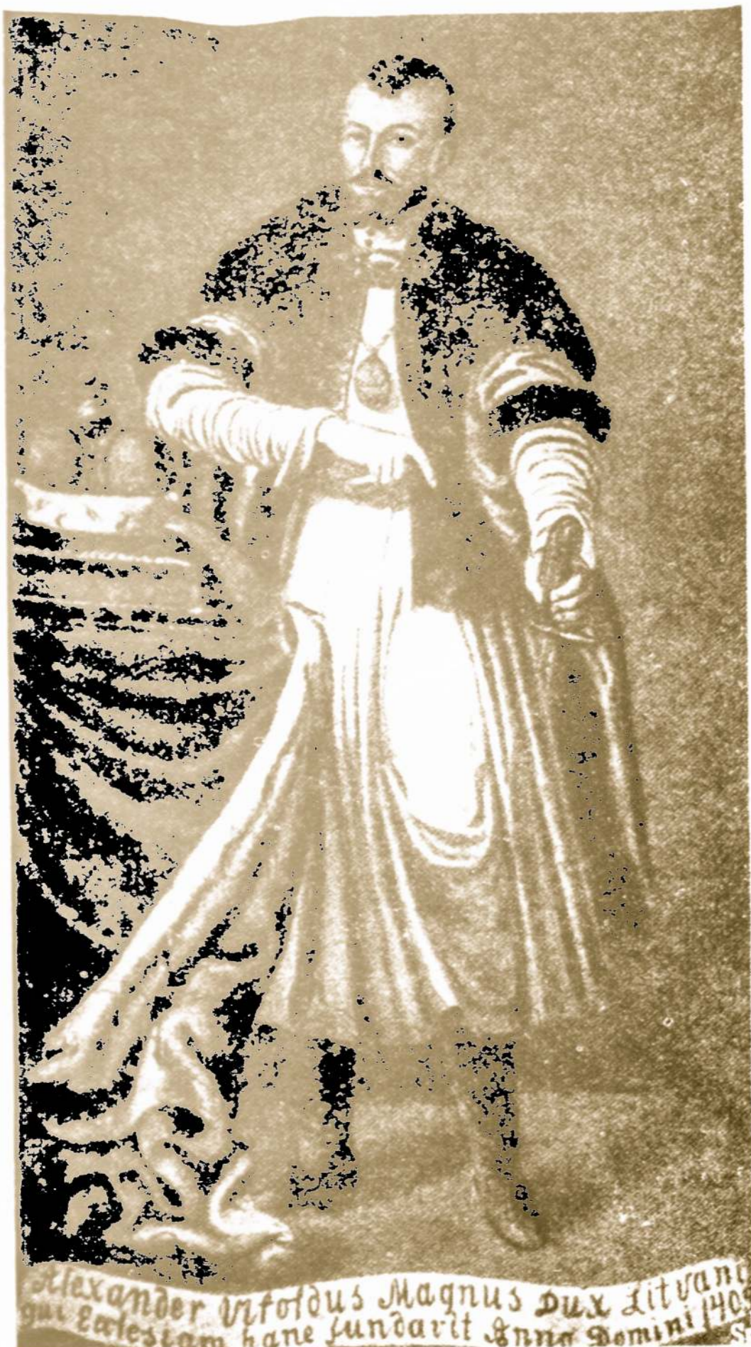
Vytauto Didžiojo paveikslas, atsiųstas iš Italijos 1409 metais, kaip dovana už platinimą krikščionybės. Paveikslas pakabintas Vytauto statytoje bažnyčioje Trakuose.