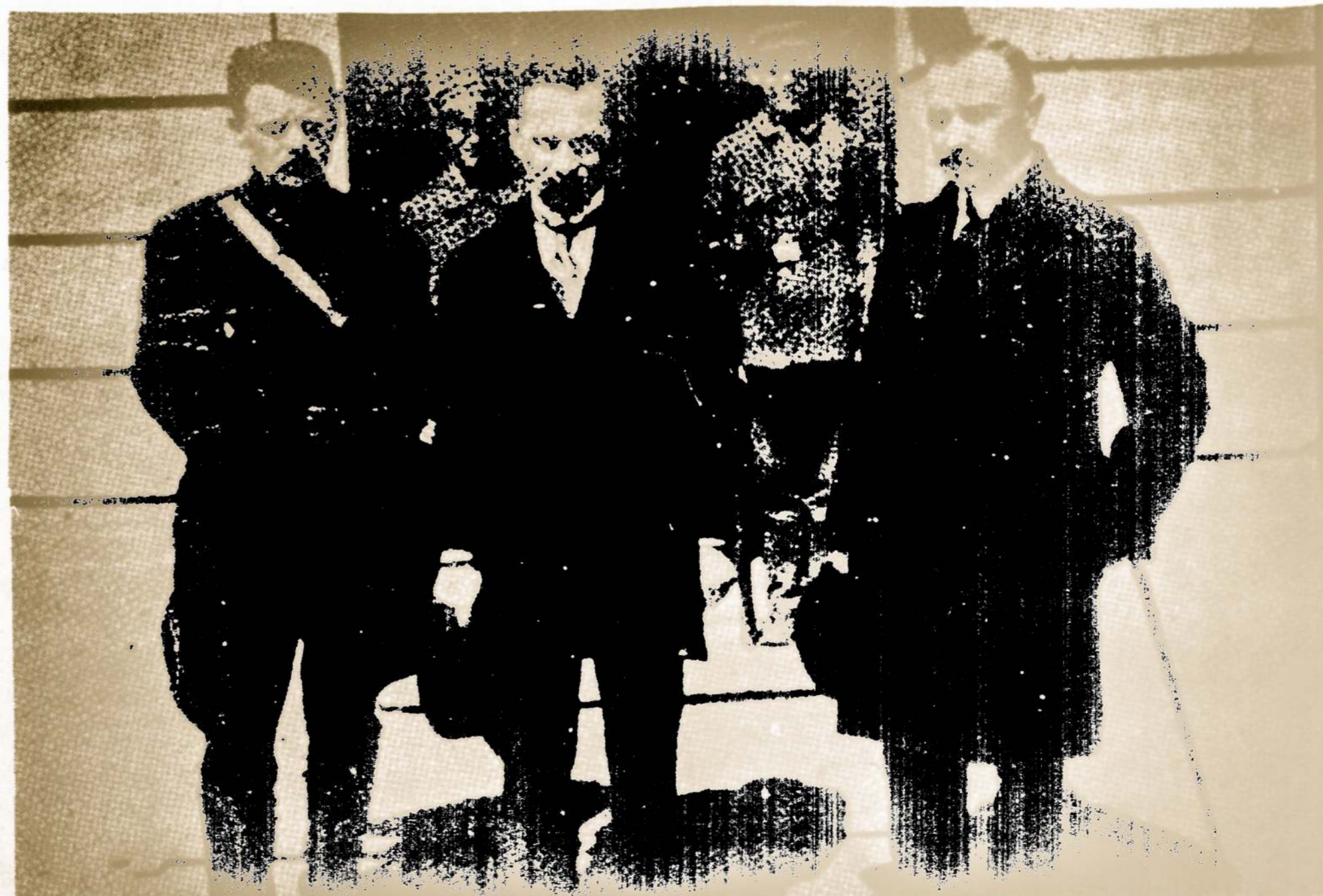
Krašto apsaugos ministeris A. Merkys, valstybės prezidentas A. Smetona ir ministeris pirmininkas M. Sleževičius 1919 m.

10 val. - 12 val. ir 1 val. pp - 6 val. vakare. (kitu laiku, esant svarbiam red. ir adm. reikalui, galima skambinti 312 - 543 - 8198.).