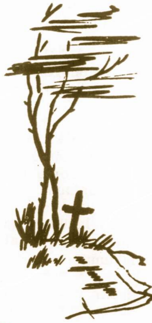
Atlikęs pareigą Tėvynėi...

Šitas atsišaukimas į savanorius Ministerių Kabineto buvo priimtas Vilniuje 1918 m. gruodžio 29 d. posėdyje