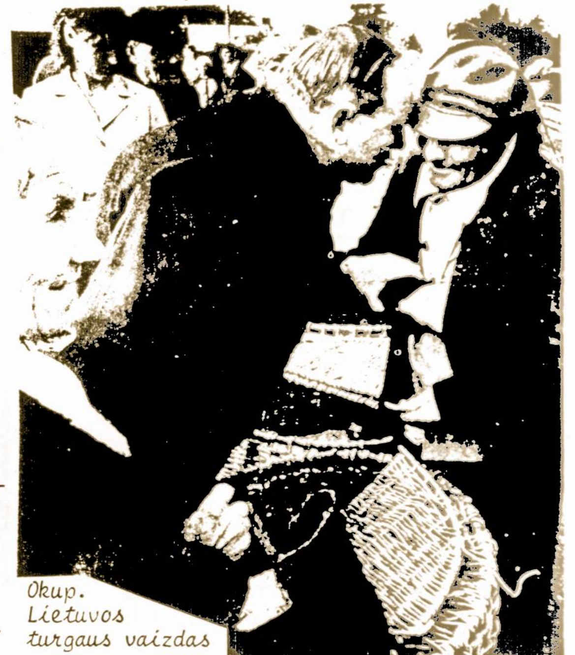
Okup. Lietuvos turgaus vaizdas

Šią tiesą jau pripazįsta, kad ir nenoromis, kad ir sukta aiškindamiesi, patys aršiausi komunistai, aršiausi "buržuazijos" priešai. Štai, okupuotos Lietuvos komunistų partijos Vilniuje leidžiamame žurnale "Švyturys" rašoma, jau pripažįstant "buržuazinio išmislo" naudingumą: - Vis dėlto einame ir pirkti, ir parduoti! pirkti prekių, nerandamų parduo-