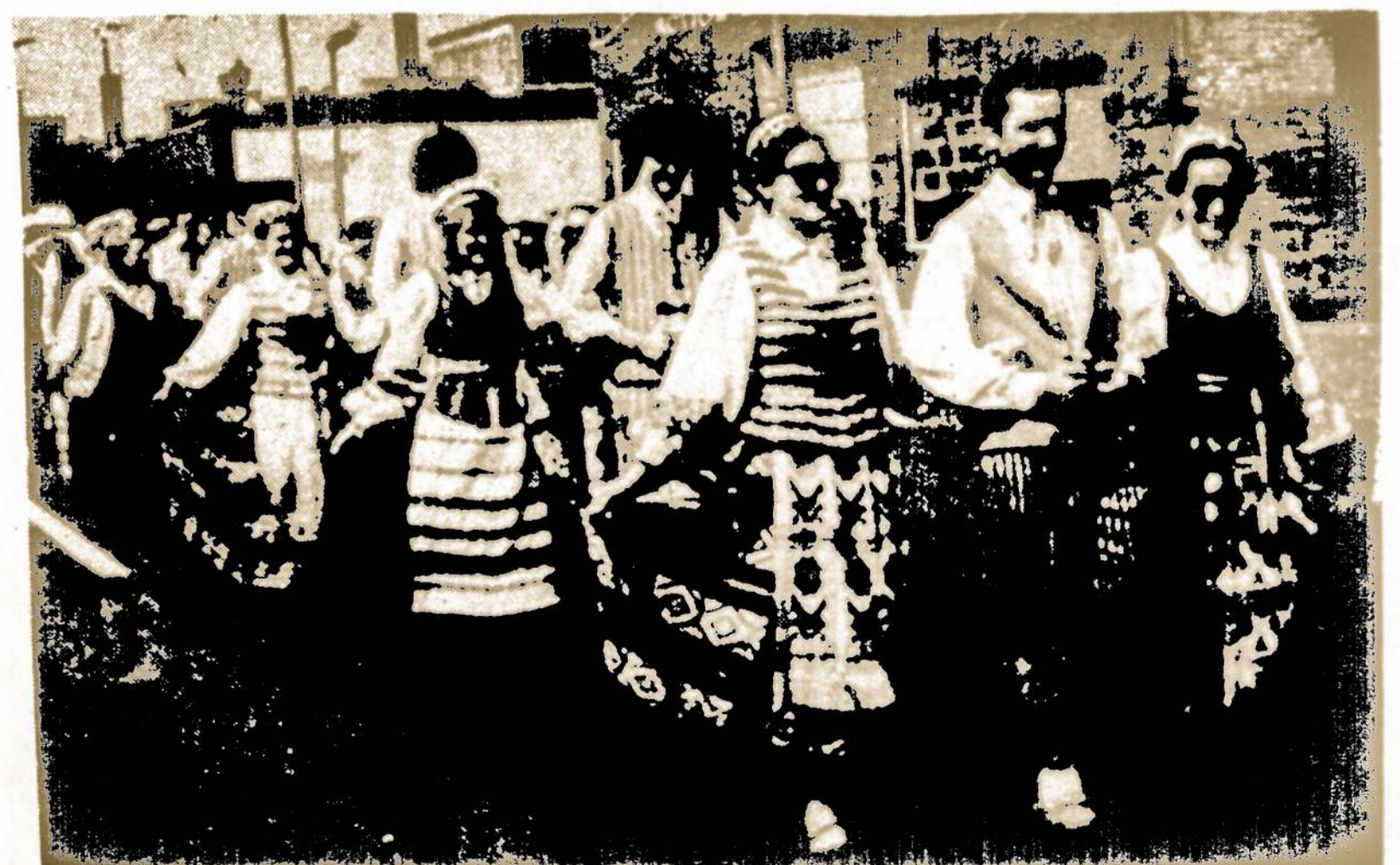
VYTAUTO DIDŽIOJO ŠAULIŲ RINKTINĖS TAUTINIŲ ŠOKIŲ grupės šokėjai Aurosos, Illinois mieste. Šokių ratelis "Vytis" atliko įvairias lietuvių programas.

VKLS-gos St. Catharines Skyriaus Valdyba 1980 m. spalio 11 d.