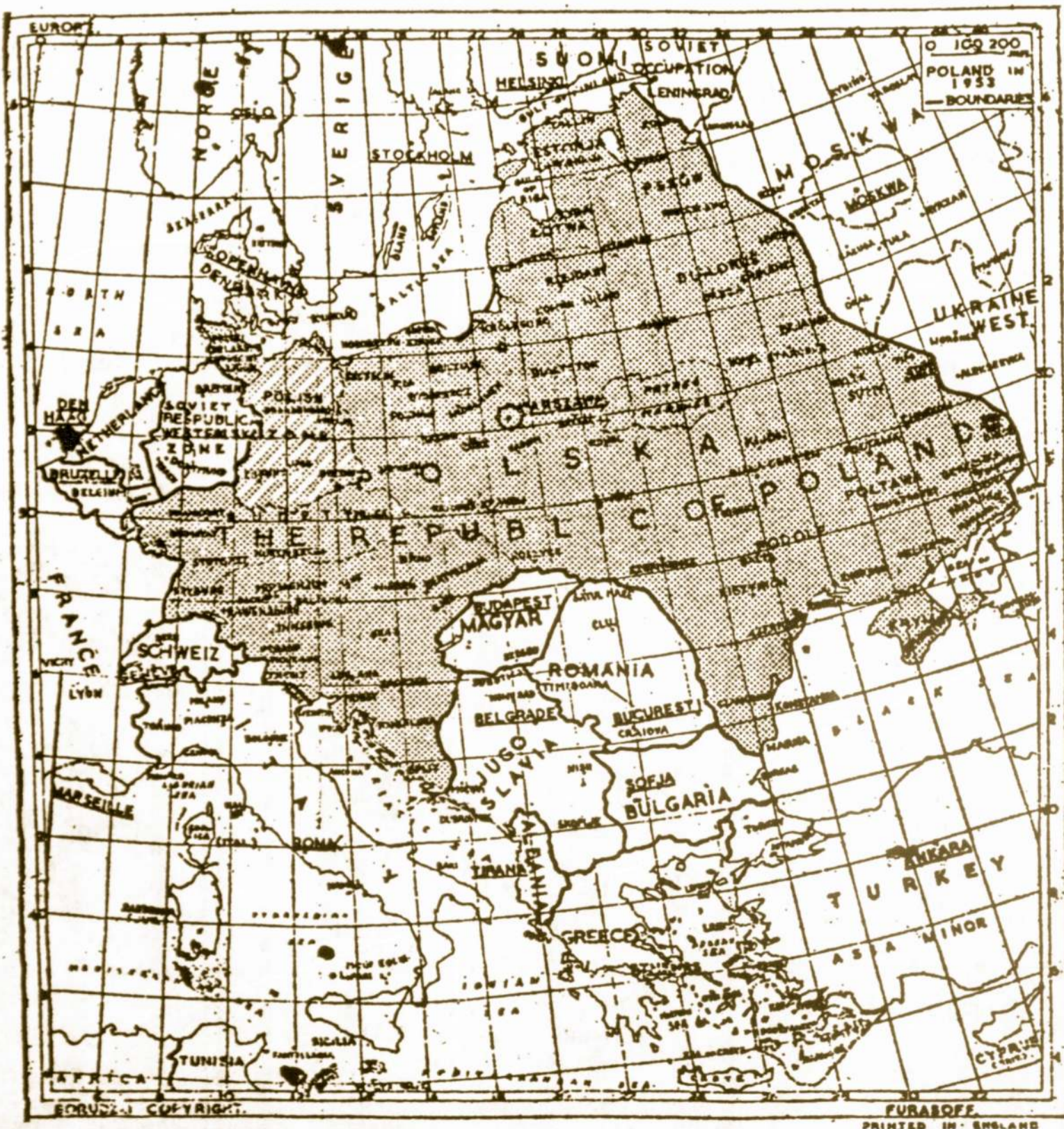
MAP OF POLAND. After the Second World War, (1939-1945), the Polish Organisations fighting for freedom and Independence made this request to the United Nations Special Commission.

neva pavergtų tautų organizavimas yra klastingas. Tiesa, kad jie nori išsivaduoti iš rusų priespaudos, bet tokia pat tiesa, kad išsivadavę eis pavergt kitas tautas, ypač Lietuvą. Jie niekur savo politikos nepakeitė. Vilnių ir Lvovą kaip skelbė, taip ir tebeskelbia lenkiškais miestais. O mes puikiai žinom, kad jie tik Vilniū nepasitenkins, nes neretai kitas tautas informuoja, kad Lietuva esanti tik Lenkijos provincija. Atkreiptinas dėmesys į čia pridėdamą žemėlapi. Nesvarbu, kad toks žemėlapis lenkus kompromituoja, bet jis ir parodo jų ateities kėslus. Vokietija iš tokio žemėlapio tik nusišypsos, tačiau Lietuvai, sykiu ir visam Pabaltijui, jau dabar yra kuo susirūpinti, nes šie kraštai Vokietijos jėgos neturi ir neturės. Lenkų agentai daž-