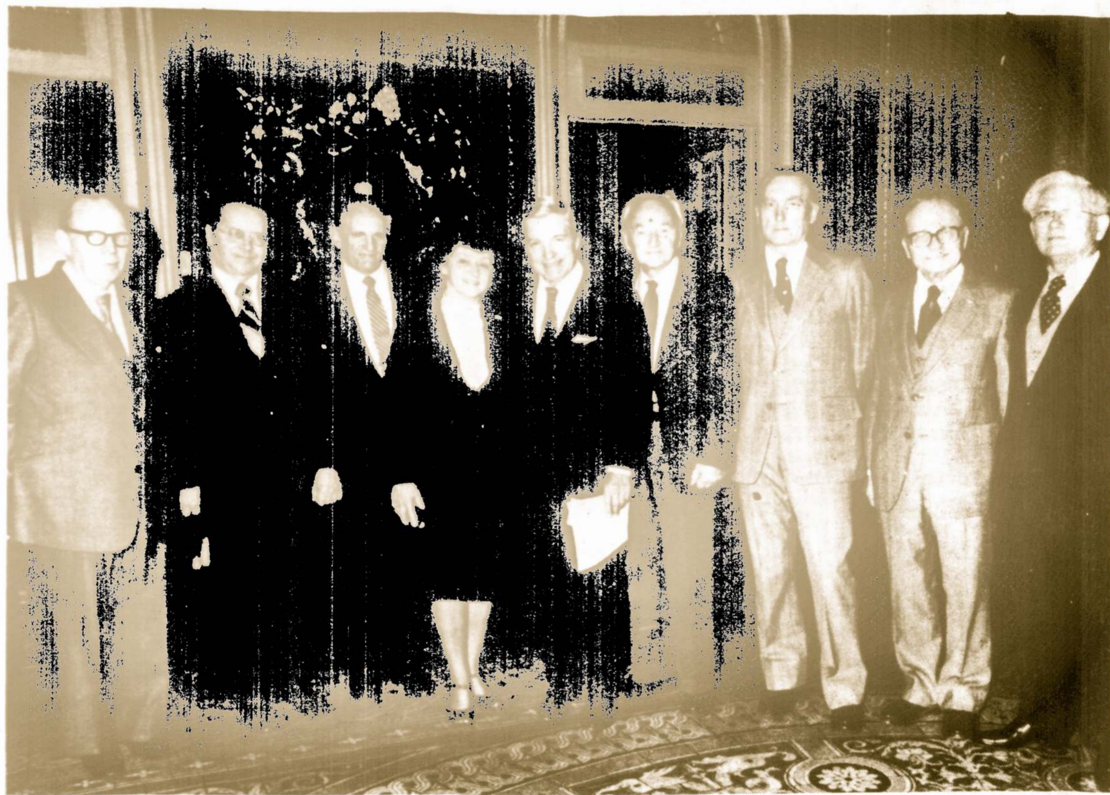
AMERIKOS LIETUVIŲ TARYBOS DELEGACIJA, kartu su Washingtono lietuviais - veikėjais, JAV Senate Lietuvos Nepriklausomybės minėjimo proga su minėjimo senate globėju sen. Charles H. Percy.