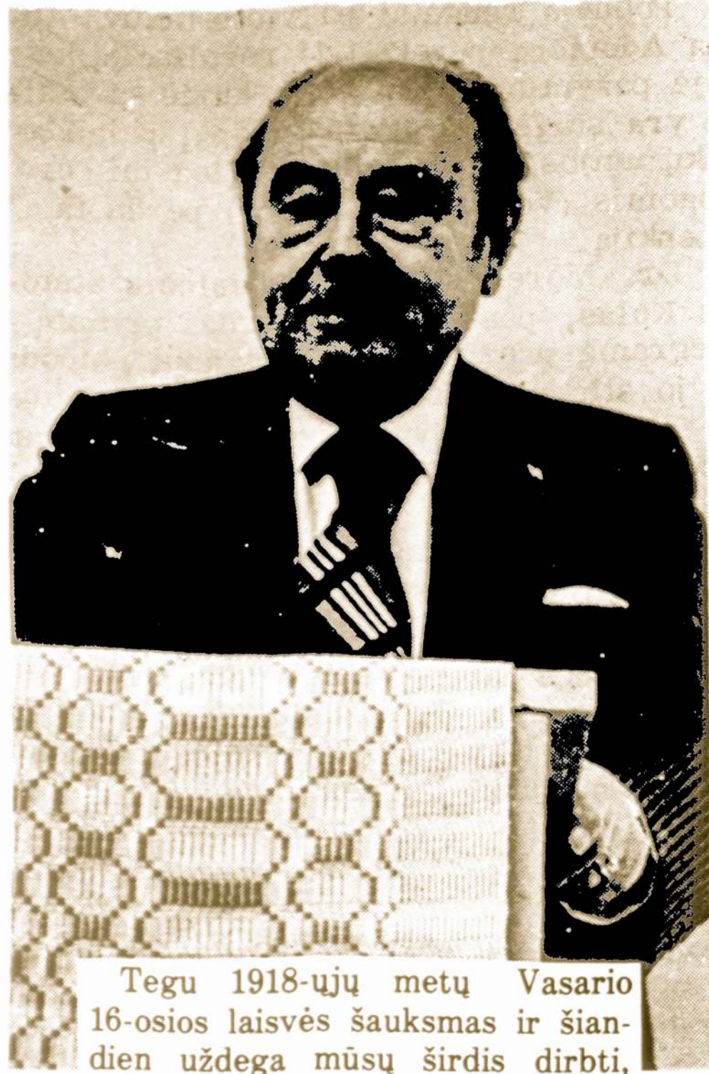
Tegu 1918-ųjų metų Vasario 16-osios laisvės šauksmas ir šiandien uždega mūsų širdis dirbti, aukotis, pasišvesti Lietuvos laisvimo pastangoms, vadovaujant Amerikos Lietuvių Tarybai.