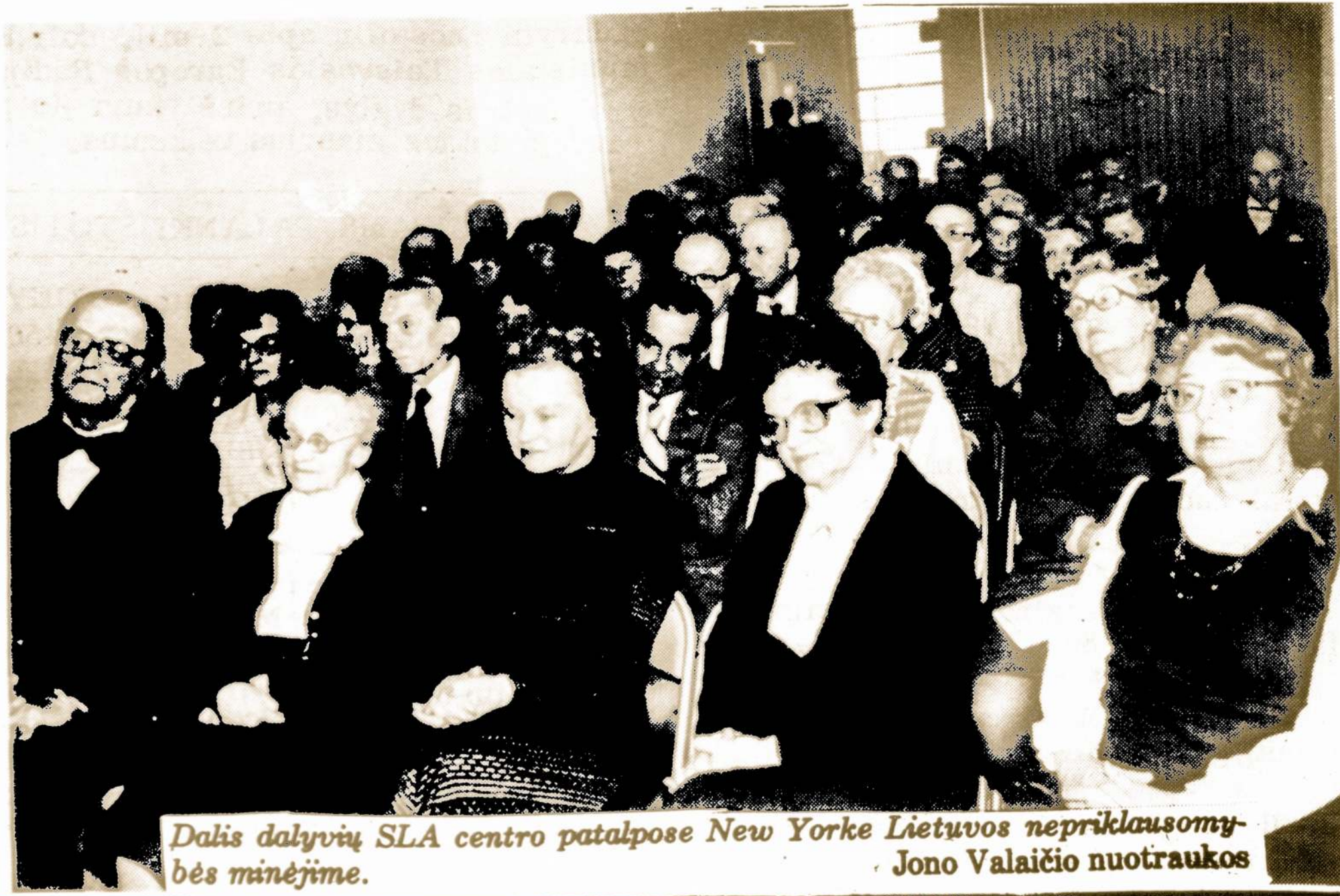
Dalis dalyvių SLA centro patalpose New Yorke Lietuvos nepriklausomybės minėjime.