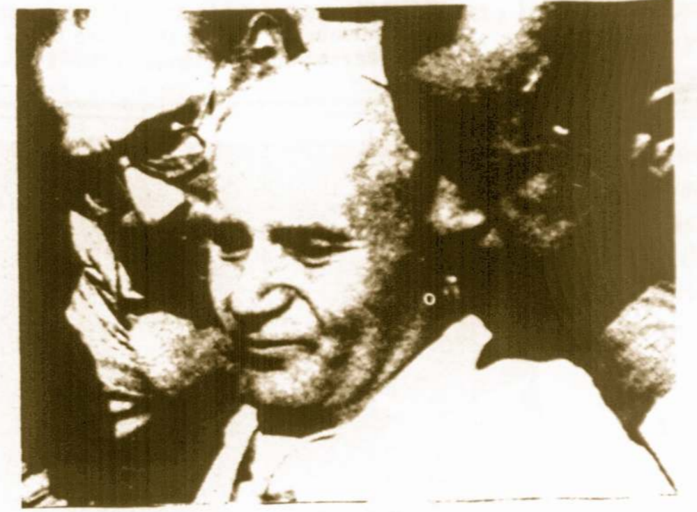
Gegužės 13 d. pasikėsinimo metu sunaikai sužeistas Popiežius. Kaip pranešama, netrukus jis grįš iš ligoninės.

JAV ore sprogo karo žvalgybos lėktuvas. Žuvo 21 karys.