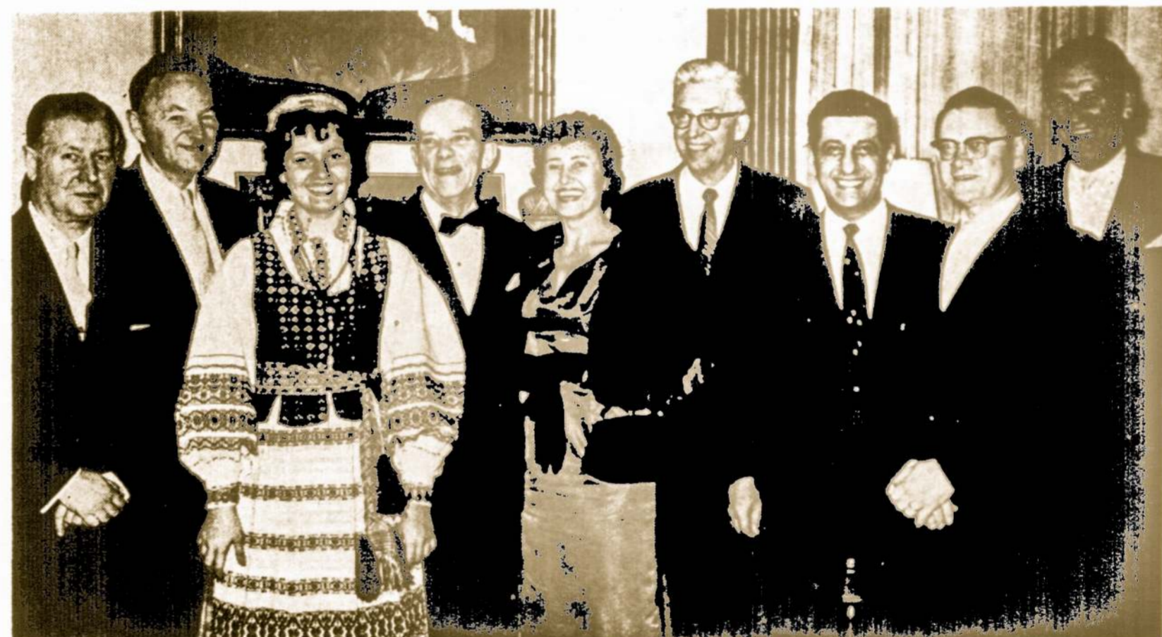
"Amerikos Balso" lietuviško tarnybos dešimtmečio minėjime Lietuvos pasiuntinybėj Washingtono 1961.II.16.