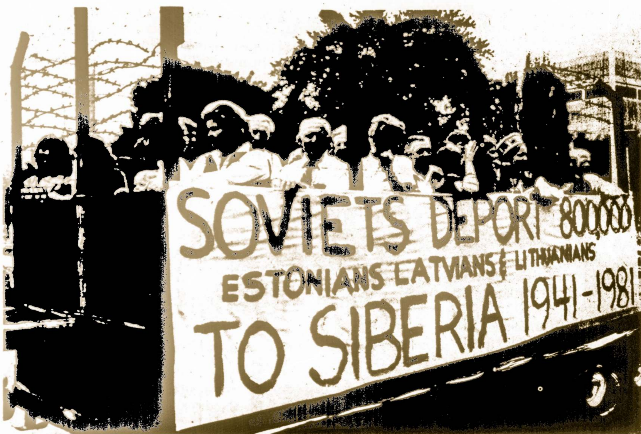
Spjgliuotom vielom apvestas sunkvežimis priminė TORONTO miesto (Kanadoje) gyventojams sovietų sibirinius trėmimus iš Pabaltijo kraštų - Estijos, Latvijos ir Lietuvos. Nuotraukoje matomas renginys suruoštas latvių.