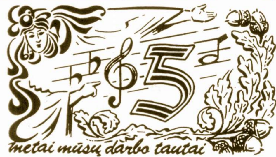
Metai mūsų darbo tautai

Matyt, kad mokyčiausios galvos dažnai nesugeba atspėti technikos kryptių ir lūžių randant naujus metodus. Lg.