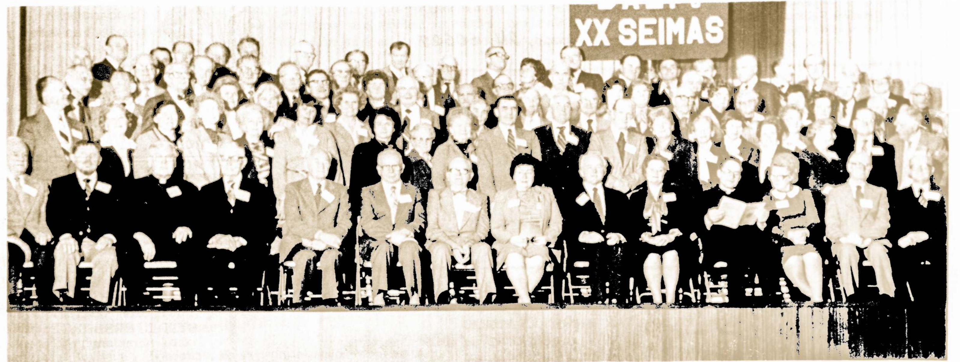
BALF'o XX SEIMO DELEGATAI IR SVEČIAI