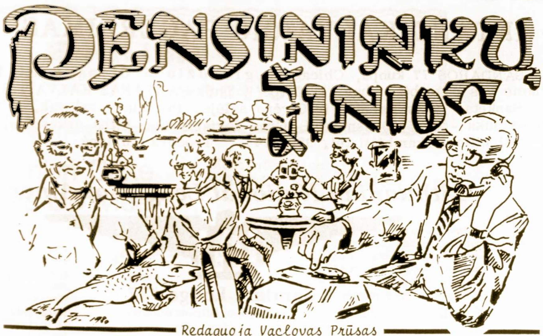
Redaguoja Vaclovas Prūsas