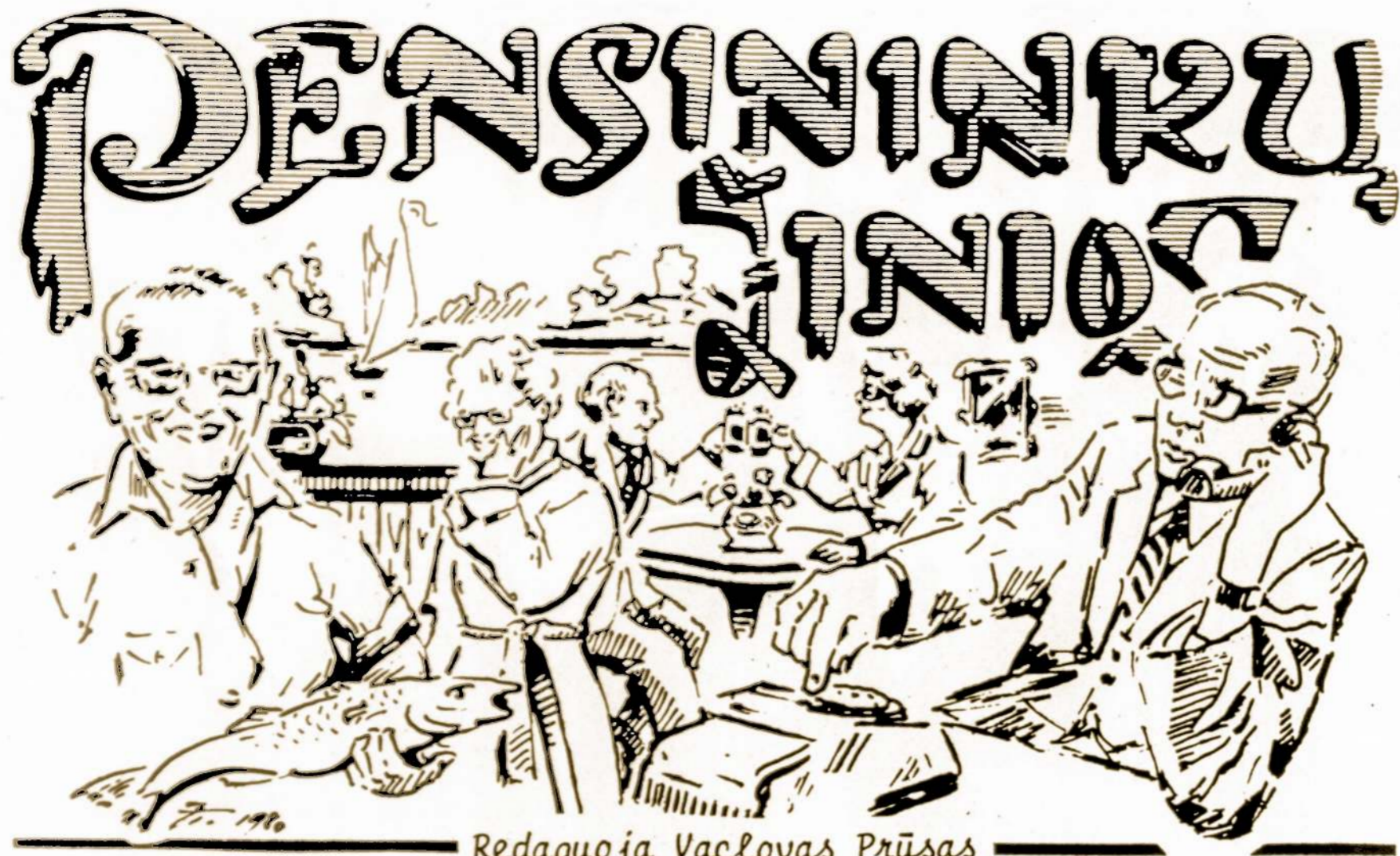
Redaguoja Vaclovas Prūsas