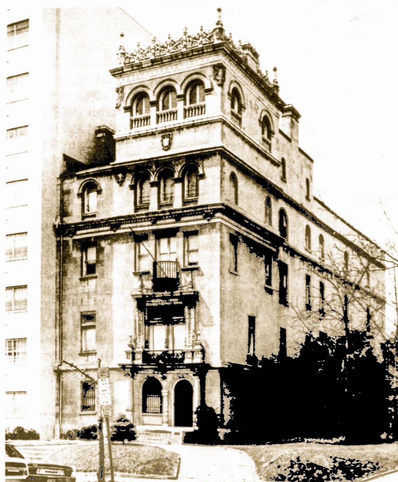
LIETUVOS PASIUNTINYBĖS RŪMAI WASHINGTONE

Naujųjų Metų proga nuoširdžiai sveikinu Lietuvos Pasiuntinybės ir savo vardu visus pavergtos Tėvynės tautiečius. Linkiu, kad ateinantieji Metai visiems atneštų šviesesnių vilčių ir geresnį rytojį.