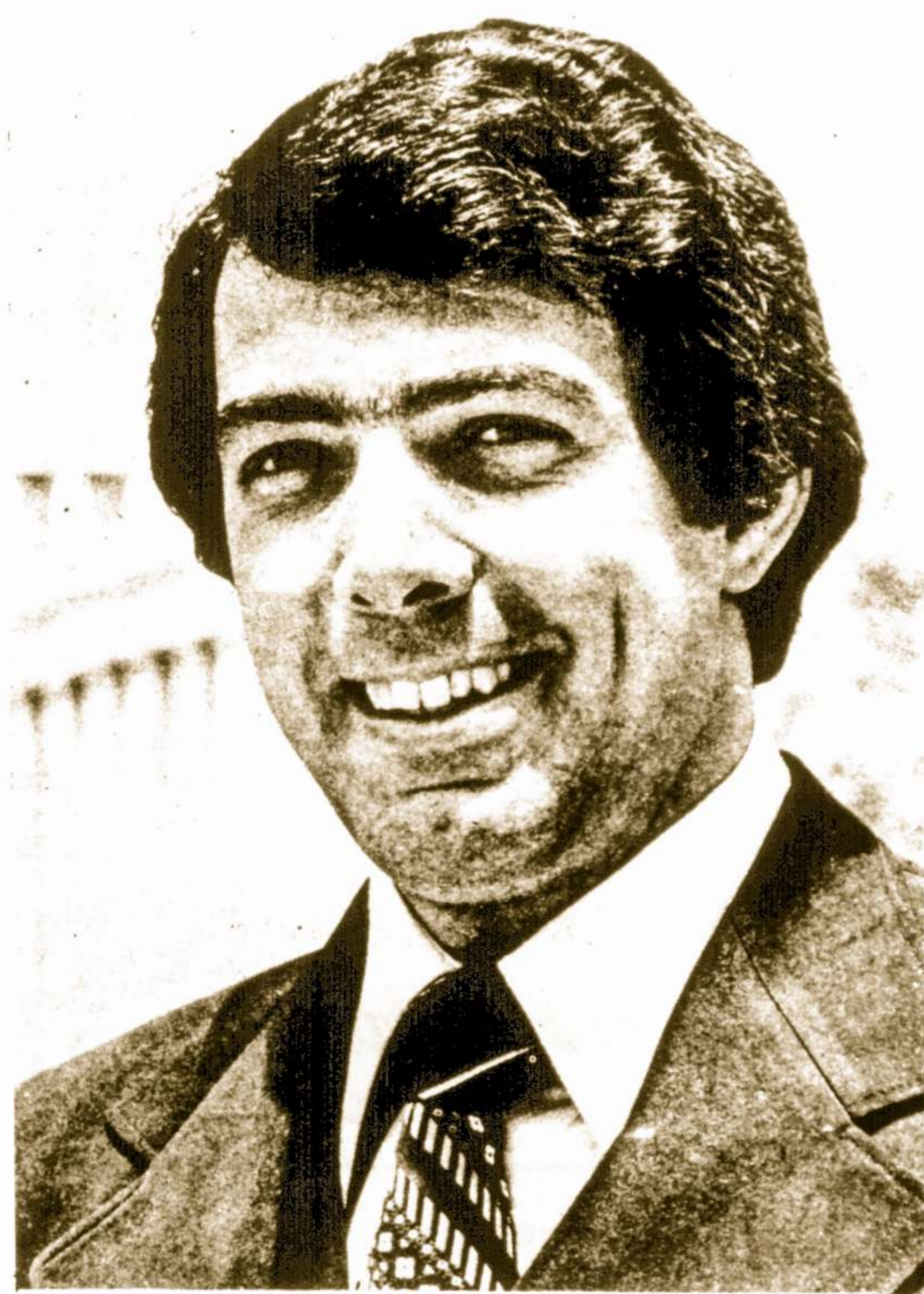
Kongresmanas MARTY RUSSO

Kongr. Marty Russo kalbės Čikagoje rengiamame Vasario 16 minėjime, vasario 14 d. 2 val.p.p. Marijos Aukšt. Mokyklos salėje.