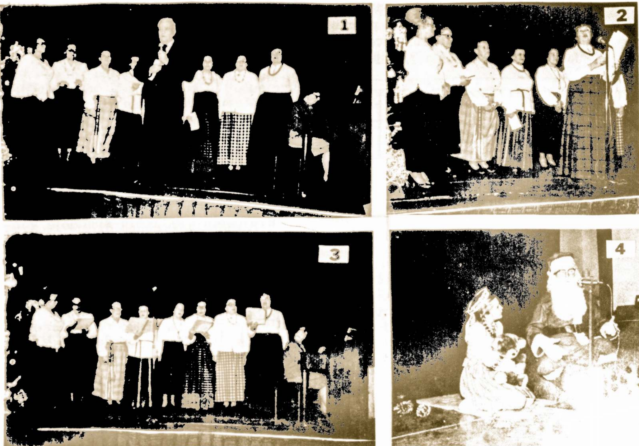
AMERIKOS LIETUVIŲ PENSININKŲ SĄJUNGOS PRIEŠKALĖDINIS POBŪVIS VAIZDUOSE