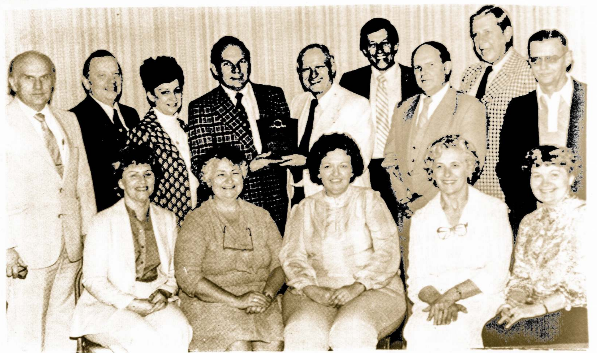
Vyčių 36-tos kuopos nariai, išpildę "Kepimo" programą.

ALTO CICERO skyrius yra išvystęs artimus ryšius su vietiniu laikraščiu "THE LIFE", kuris noriai skelbia to ALTO skyriaus vadovybės pateikiamas žinias apie lietuvius.