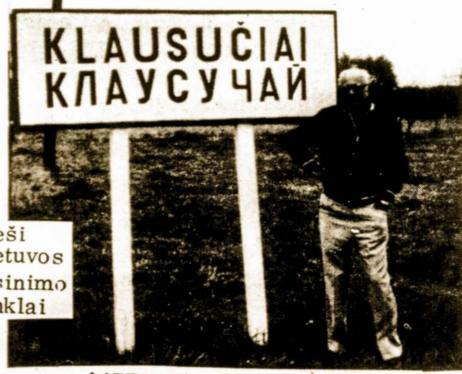
Vieši Lietuvos rusinimo ženklai