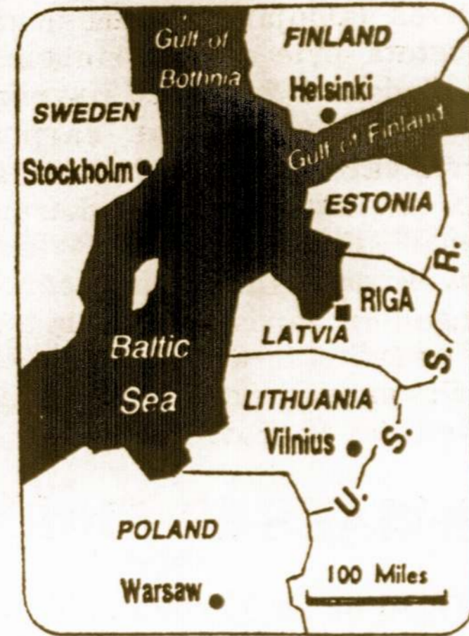
Latvia, Estonia, and Lithuania were incorporated into the Soviet Union.

The State Council adopted the white mounted knight, charging to the left, as the official coat of arms. It was the symbol of the Grand Duchy of Lithuania in the Middle Ages. Also, they adopted the national flag with yellow (top) for