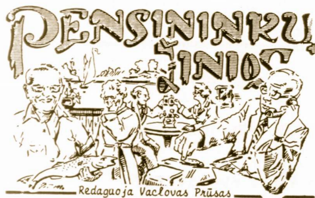
Redaguoja Vaclovas Prūsas